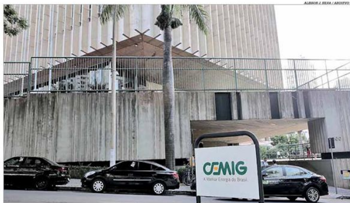
Cemig devolverá, por ora, aos consumidores, R$ 714,4 milhões, que retornarão a eles em forma do não reajuste

A grande discussão em torno do aumento das tarifas em Minas gira em torno da quantia que será recebida pela Cemig, na ordem de R$ 6 bilhões, por pagamentos indevidos do imposto sobre Circulação de Mercadorias e Prestação de Serviços (ICMS), que posteriormente foi retirado da base de cálculo do Programa de Integração Social/ Contribuição para o Financiamento da Seguridade Social (PIS/ Cofins). O senador Rodrigo Pacheco defende que o recurso pertence aos consumidores, que foram cobrados a mais por um período de quatro anos, entre 2008 e 2011. Pág. 5