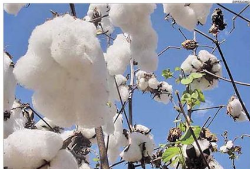
A valorização da pluma do algodão não era esperada e surpreendeu o setor no Estado

A alta foi uma surpresa para o segmento, que estima uma produção de 65 mil toneladas de pluma para a safra atual, sendo 50% dela voltada à exportação. O principal destino é o mercado asiático, com destaque para a China, Vietnã, Bangladesh, Indonésia e Turquia. Pág. 8