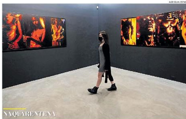
FOTO E PINTURA, UNIDAS PELO CUBISMO

Maureen Bisilliat em nova mostra (acima). Na galeria e na web. PÁG. 08