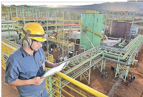
Musa se tornou uma das maiores produtoras de minério de ferro de todo o País

campos econômico, social e ambiental. Nos planos, está a execução do aguardado Projeto Compactos. Há anos em fase de estudos, o programa visa à ampliação da capacidade do braço de mineração da siderúrgica para 29 milhões de toneladas. Pág. 4