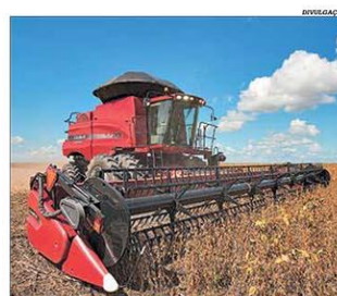
A Case IH está investindo em máquinas melhores

Com a clara colaboração do governo brasileiro, que parece enxergar nas políticas ambientais, especificamente com relação à Amazônia, uma espécie de conspiração contra o País patrocinada por esquerdistas, ganhou força nos últimos dois anos campanha mundial imputando ao Brasil todos os pecados. Por pior que possa ser a política brasileira é preciso atentar para o fato de que não existem inocentes nessa história e sim uma bem orquestrada movimentação, muito anterior ao governo Bolsonaro, cujo objetivo final seria a internacionalização da região ou algum tipo de intervenção, sob o argumento de que os brasileiros se mostraram incapazes de conservar a floresta. A cobiça, está claro, alimenta estes movimentos, ainda que sob o disfarce de que se trata de proteger o bioma, falsamente apontado como pulmão do planeta. "Concorrência que incomoda", pág. 2