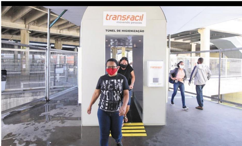
ESTRATÉGIA - Em nova ação para tentar evitar propagação da Covid, Estação Pampulha recebeu, ontem, "túnel de desinfecção" para passageiros