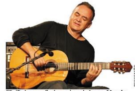
"Baão barroco", obra-prima de Juares Moreira, ganha videoclipe e execução pela Orquestra Sesiminas Musiccoop para homenagear profissionais da saúde. ALMANAQUE - P.12