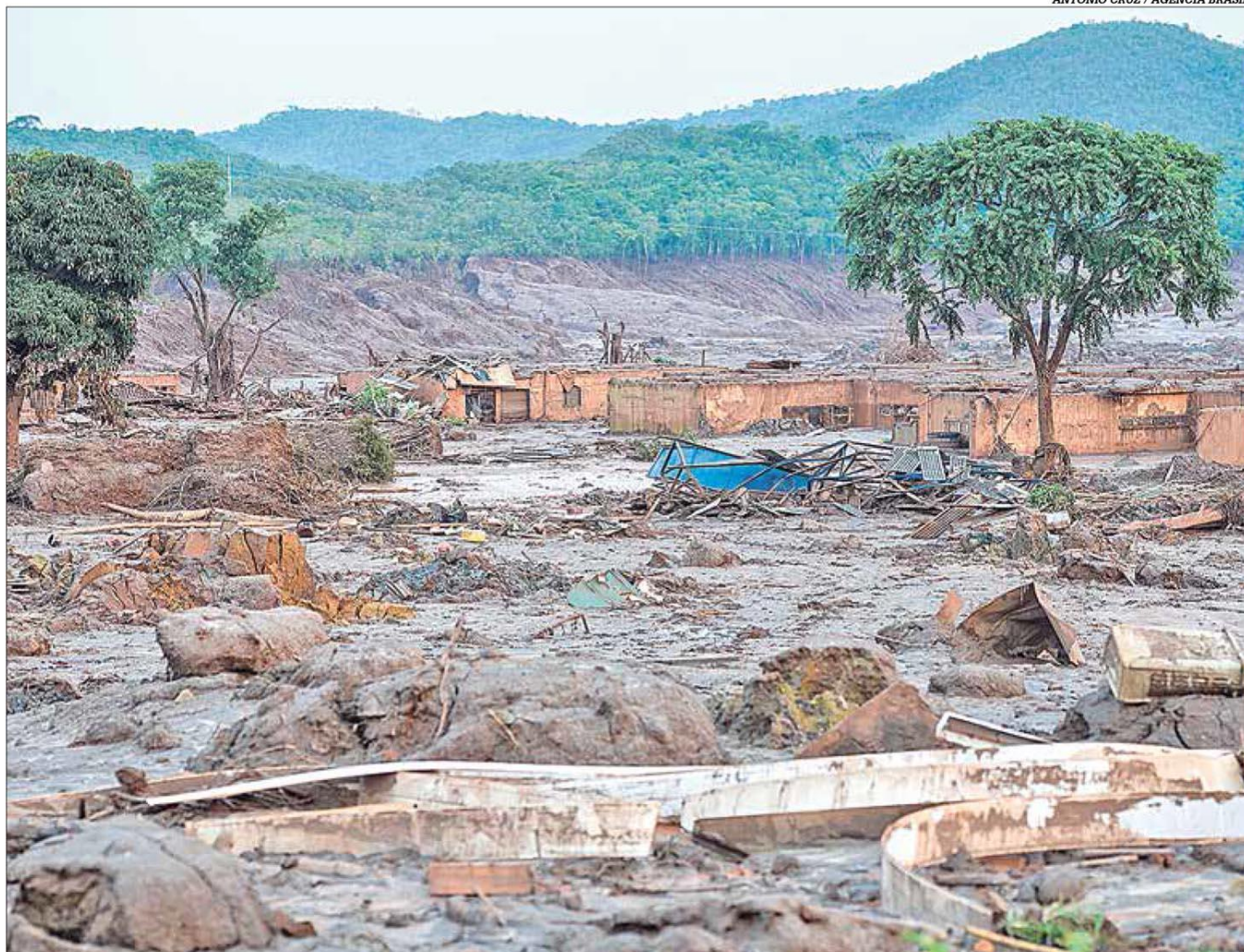
Rompimento da barragem de Fundão, em Mariana, em 2015, trouxe diversos prejuízos ambientais e econômicos para Minas