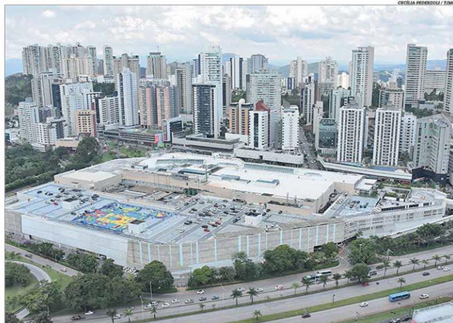
Os shopping centers da Capital poderão retomar as suas atividades durante três dias seguidos por semana

BELO HORIZONTE, QUARTA-FEIRA, 5 DE AGOSTO DE 2020