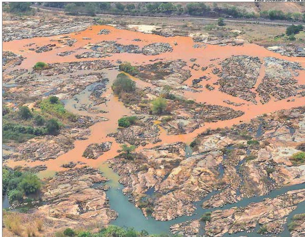
A bacia do Rio Doce foi degradada pelo rompimento de barragem em Mariana

Um investimento de quase R$1 bilhão em ações integradas dos governos de Minas Gerais e Espírito Santo de reparação na bacia do Rio Doce, que foi degradada e acumula prejuízos causados pelo rompimento da barragem de Fundão, em Mariana, em 2015, foi anunciada pelo governador Romeu Zema. Foram homologados ontem aportes de R$ 416 milhões para estruturação de escolas estaduais e municipais, pavimentação de estradas, retomada das obras do Hospital Regional de Governador Valadares e a implantação de Distrito Industrial em Rio Doce. Os recursos virão de repasse financeiro da Fundação Renova. Pág. 4