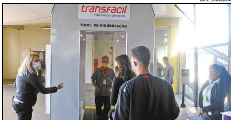
Já em funcionamento em estação do BHBus, o lança névoa ozonizada promete desinfetar roupas, acessórios e até mesmo a pele de quem passa pela cabine

*Estagiária sob supervisão da subeditora Rachel Botelho