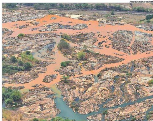
A bacia do Rio Doce foi degradada pelo rompimento de barragem em Mariana

Um investimento de quase R$1 bilhão em ações integradas dos governos de Minas Gerais e Espírito Santo de reparação na bacia do Rio Doce, que foi degradada e acumula prejuízos causados pelo rompimento da barragem de Fundão, em Mariana, em 2015, foi anunciada pelo governador Romeu Zema. Foram homologados ontem aportes de R$ 416 milhões para estruturação de escolas estaduais e municipais, pavimentação de estradas, retomada das obras do Hospital Regional de Governador Valadares e a implantação de Distrito Industrial em Rio Doce. Os recursos virão de repasse financeiro da Fundação Renova. Pág. 4