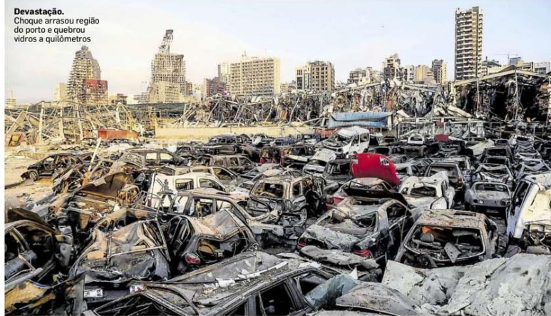
Devastação. Choque arrasou região do porto e quebrou vidros a quilômetros

Uma explosão na região portuária de Beirute, no Líbano, matou pelo menos 78 pessoas, feriu 4 mil e espalhou destruição por quilômetros. O governo afirmou que um curto-circuito causou incêndio e explosão em um depósito de fogos e em outro onde estavam 2,7 mil toneladas de nitrato de amônia. O prédio da embaixada do Brasil foi afetado. A fragata brasileira Independência, usada em missão da ONU no país, deixou o local cerca de dez minutos antes da explosão. A hipótese de atentado foi afastada, mas o acidente levou o país ao caos, alvo frequente de violência sectária. INTERNACIONAL / PÁGS. A14 e A18