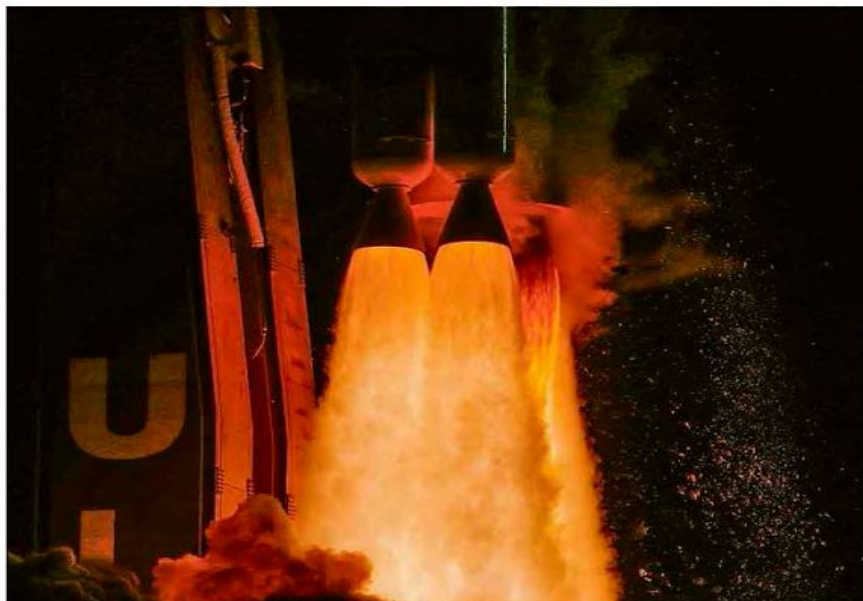
Lançamento do foguete Atlas 5, no Cabo Canaveral, na Flórida (EUA), que levou ao espaço a missão Mars 2020.

A respeito de saída abrupta de Weintraub do Brasil.