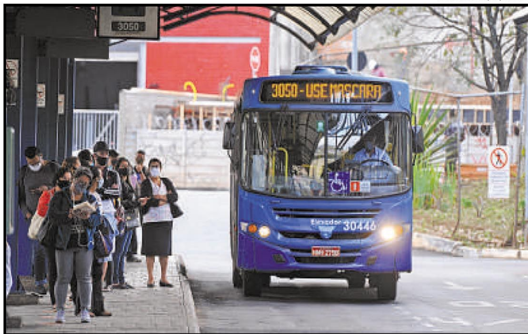
Descontos nas passagens fora de horário de pico são opção cogitada para conter superlotação em coletivos

“O acordo com o Ministério Público abre uma possibilidade de a PBH conceder desconto na