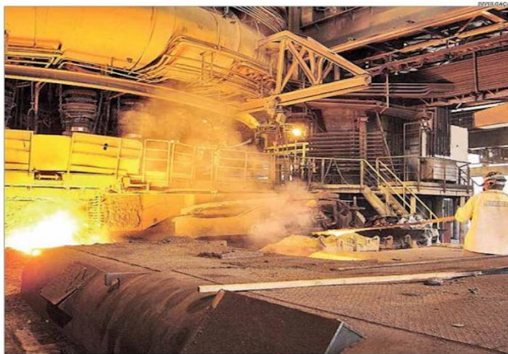
A Usiminas elevou o plano de investimentos de R$ 600 milhões para R$ 800 milhões em 2020

Companhia fecha 2º trimestre com prejuízo de R$ 395 milhões