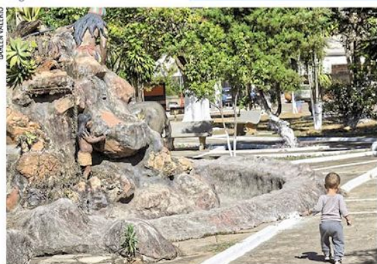
Fim do sossego. Com 4.000 moradores e sem hospital, Santa na do Riacho registra os dois primeiros casos de Covid-19. Página 6