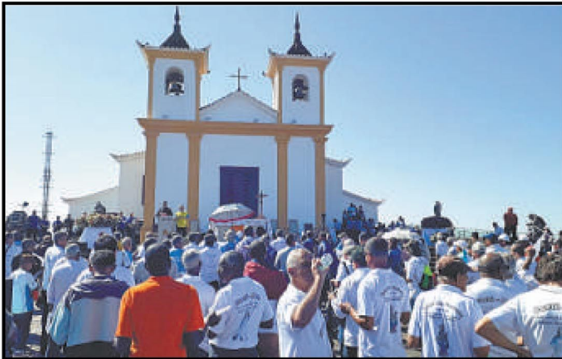
Romeiros diante da ermida durante homenagem a Nossa Senhora da Piedade em 2019: neste ano, basílica será aberta somente para um grupo de vicentinos

berdade, na Região Centro-Sul de Belo Horizonte.