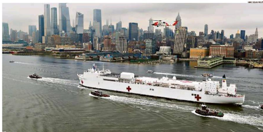
Alento. O navio-hospital USNS Comfort chega ao porto de Nova York. Embarcação, que tem mil leitos e 12 centros cirúrgicos, vai atender casos que não sejam de Covid-19 para 11 bairros hospitais da metrópole

CONFIRMADOS 4.579 MORTOS 159 FONTES: UNIVERTHO DA SAÚDE