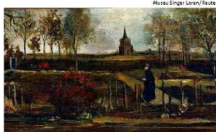
Obra furtada de Van Gogh retrata jardim da reitoria de Nuenen

Pesquisa capenga Acerca de alocação de verbas federais para ciências.