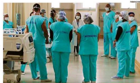
Com 200 leitos para pacientes com Covid-19, o Hospital de Bonsucesso está com tudo pronto, mas não recebeu testes e corre contra o tempo para transferir sete pacientes recém-operados que correriam risco. PÁGINA 12