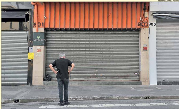
Se o governo não assumir as rédeas da crise do novo coronavírus, o cenário ficará muito pior, advertem os especialistas