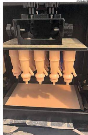
Respiradores são produzidos com parceria

Diante da necessidade urgente de distribuir equipamentos médicos para atender à demanda ascendente dos hospitais com o novo coronavírus, três empresas de tecnologia se uniram para produzir respiradores e os chamados "face shield", ou protetores de face, dedicados aos profissionais de saúde, em Minas Gerais, sob a coordenação da Codemge. A Compass 3D fabrica as peças; a Astroscience fornece a resina utilizada na impressão e a Clever avalia os arquivos para manufatura do "face shield", por meio de fabricação com filamento fundido, reduzindo o tempo de produção. Pág. 13