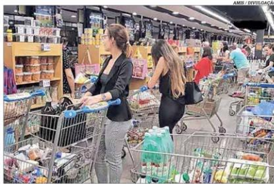
A formação de estoques pressiona os preços nos supermercados

O crescimento na demanda por alimentos e a alta nos custos do transporte de cargas elevaram os preços de produtos essenciais nos supermercados mineiros. A maior procura por itens básicos, como arroz, feijão, leite e ovos, diante do isolamento social, alavancou os preços nas gôndolas, aponta a Amis. A entidade afirma que o abastecimento nos supermercados está garantido e orienta os consumidores a não formar estoques de alimentos para conter o aumento de preços. Pág. 4