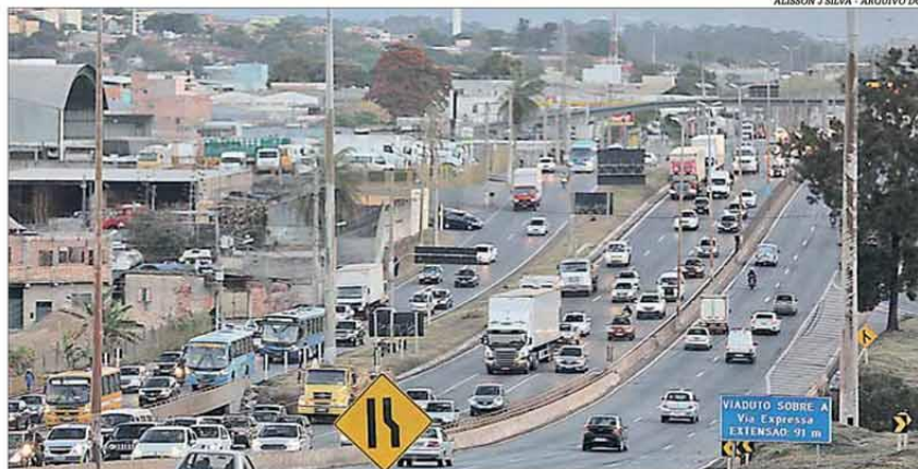
Marcato: estudos devem ser apresentados à iniciativa privada em outubro