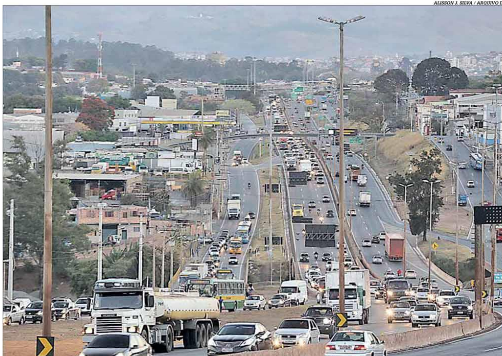
O novo projeto prevê a modernização viária do Anel Rodoviário de Belo Horizonte, com divisão em três alças

Estado quer realizar licitação em 2021 com perspectiva de aportes de R$ 9 bilhões