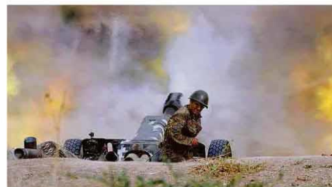
Militar de Nagorno-Karabakh, disputado por Armênia e Azerbaijão, usa artilharia.

Se nada faço, sou omissa; se faço, estou pensando em 2022 Jair Bolsonaro, ao falar sobre o Renda Cidadã. Mercado A19