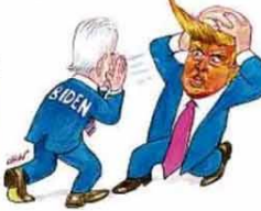
— Ei, meu cabelo não!