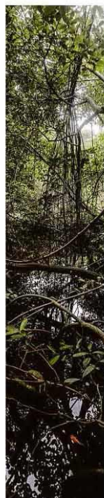
Mangue no Complexo de Salgado Filho, em PE.

Estufa para cultivo da empresa Breath of Life Pharma, perto de Tel Aviv; regulação moderna fez avançar desenvolvimento de medicamentos. Mundo A14 a A16