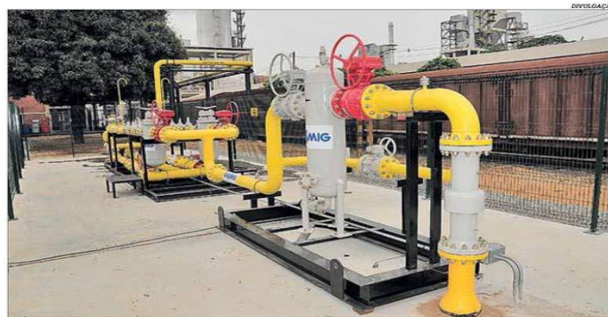
A Gasmig deve investir R$ 80 milhões para ampliar a rede residencial de gás até dezembro

De acordo com o Caged, é o terceiro mês consecutivo de déficit de vagas com carteira de trabalho no Estado. Em maio, foram realizadas 111.101 contratações contra 146.989 demissões. O resultado negativo no acumulado do ano chega a 111.555 empregos em Minas, que fica atrás apenas de São Paulo e Rio de Janeiro. Os setores mais impactados com o fechamento de vagas foram de comércio, serviços, indústria e construção. Apenas a agropecuária obteve resultado positivo em 2020. Pág. 4