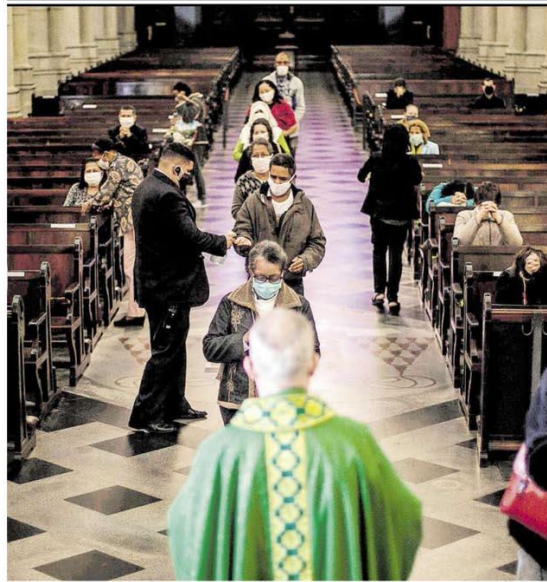
Catedral da Sé retoma missas Com álcool em gel e distanciamento, cerca de 50 fiéis assistiram à primeira missa após a reabertura. A Prefeitura de SP, que ontem encerra atividades do hospital de campanha do Pacaembu, estuda deixar de usar leitos privados. METRÓPOLE / PÁG. A17