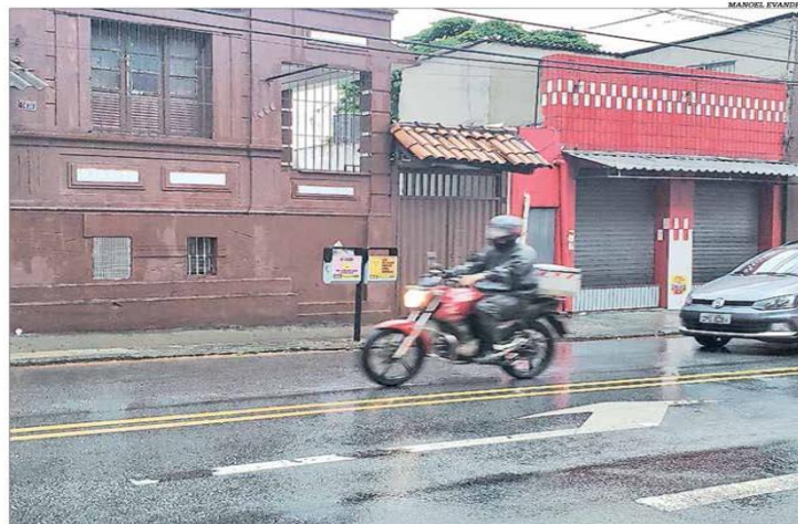
Os setores do comércio e serviços estão entre os que mais eliminaram empregos com o Covid-19

Estado perdeu 33.695 postos de trabalho apenas em maio