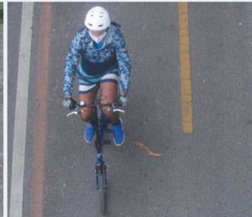
ISOLAMENTO? – Gente sem máscara, desprezo à distância mínima, uso de equipamentos públicos e atividade física no meio da rua: "A população tem que ser parceira", pede médico