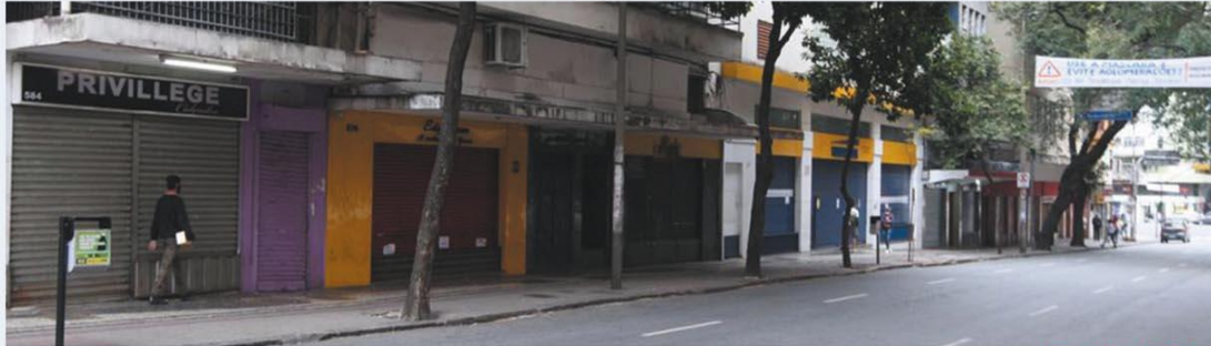
QUARENTENA NA MARRA – Proibição de funcionamento das lojas deixou rua São Paulo, bem no Centro de BH, com "cara de domingo"; desobediência pode levar a recolhimento de alvará