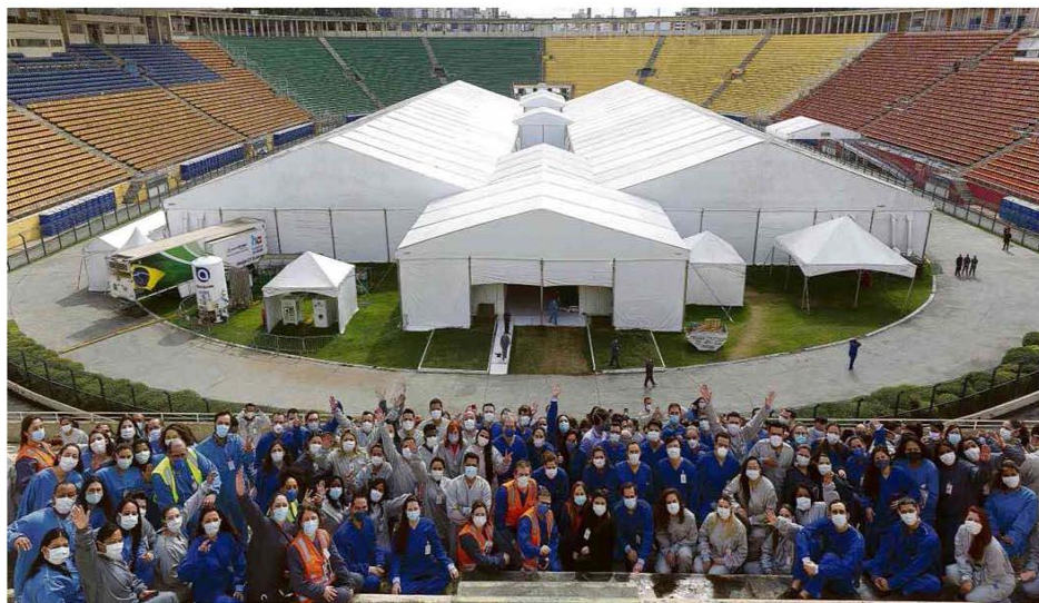
Equipe médica que trabalhou no hospital de campanha do Pacaembu, ontem, após a alta dos últimos pacientes; unidade foi a primeira voltada para a Covid-19 na capital.

Ilustrada B7 Live expõe problema com direito autoral, e DJs penam para ganhar dinheiro