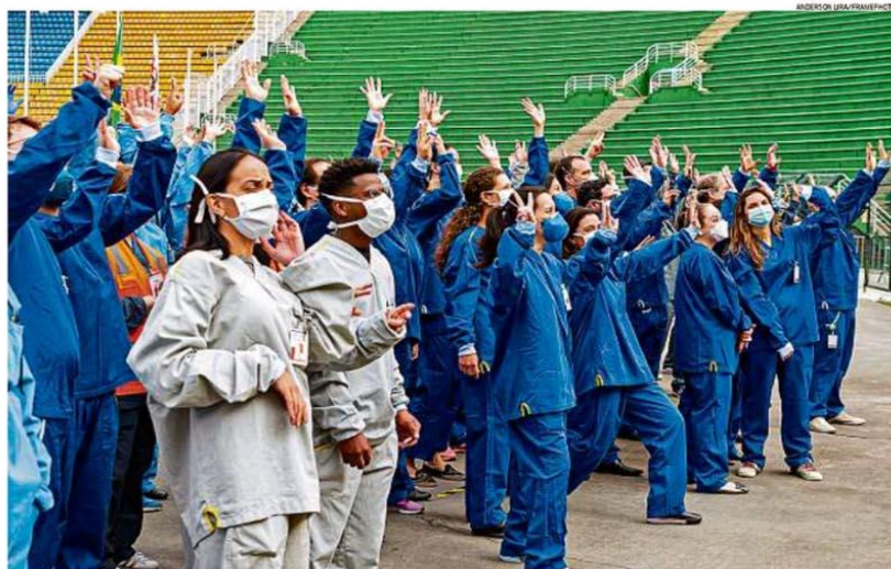
Funcionários do Hospital de Campanha do Pacaembu comemoram o fechamento da unidade após 84 dias em ação. O prefeito de São Paulo, Bruno Covas, disse que o atendimento vinha caindo dia a dia. Equipamentos serão doados a hospitais de regiões onde a Covid-19 está crescendo. PÁGINA 9