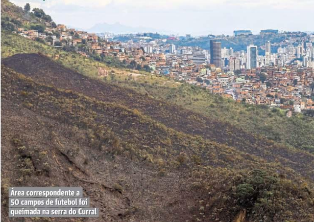
Área correspondente a 50 campos de futebol foi queimada na serra do Curral