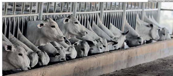
O crescimento no consumo de proteína animal reflete na maior demanda de ração animal

A produção brasileira de ração animal cresceu 4,3% no primeiro trimestre frente a igual período de 2019, estimulada pelo aumento das exportações de carnes e pelo consumo maior de proteína animal pelas famílias. O volume atingiu 18,9 milhões de toneladas, de acordo com o Sindirações, e a expectativa é fechar 2020 com montante de 80 milhões de toneladas, alta de 3,8% em relação ao ano passado. Em 2019, Minas Gerais respondeu por cerca de 11% da produção nacional de rações, com um volume estimado em 8 milhões de toneladas. No País, a produção de ração bovina chegou a 2,44 milhões de toneladas de janeiro a março, volume 5,6% superior ao mesmo intervalo do ano anterior. Pág. 10