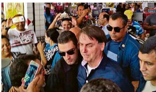
Peias ruas, Bolsonaro cumprimenta apo adores e é assed ado enquanto visita comerc artes em cidades-satélites de Brasília

Um dia depois de o ministro da Saúde, Luiz Henrique Mandetta, recomendar medidas para restringir a circulação de pessoas em todo o país, o presidente Jair Bolsonaro visitou ontem comerciantes no Distrito Federal. Durante a caminhada, ele ignorou as medidas propostas ao cumprimentar apoiadores e causou aglomerações para fotografias. Depois, chegou a dizer que cogita decreto liberando toda a população para voltar ao trabalho. O Twitter encheu de vídeos que Bolsonaro havia publicado da agenda de rua per serem "contra informações de saúde pública". PÁGINA 4