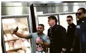
O presidente Jair Bolsonaro tira selfie com funcionário de açougue em Sobradinho (DF)