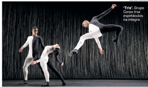
'Triz', Grupo Corpo traz espetáculos na íntegra

Série mistura ficção e realidade. PÁG. H8