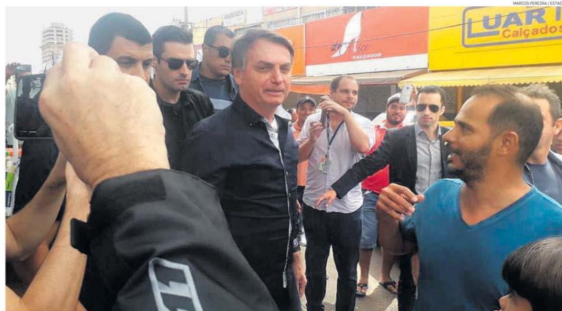
Corpo a corpo. Bolsonaro na rua, com apoiadores: "Uma experiência que recomendo a todos os políticos do Brasil", afirmou, em rede social

20 mil é a média de novos casos de contaminação por dia nos EUA