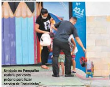
Unidade na Pampulha reabriu por conta própria para fazer serviço de "hotelzinho"