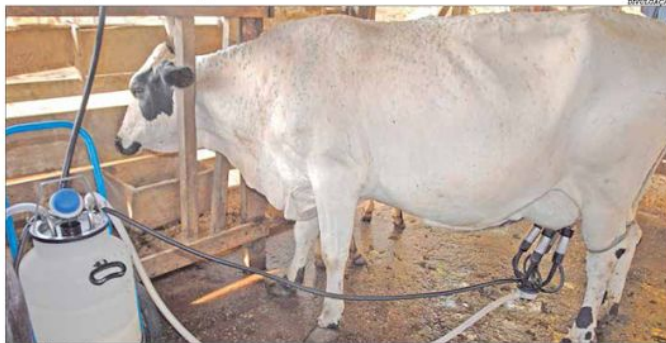
A tendência é de queda nas cotações do leite até janeiro com a recuperação das pastagens e as chuvas

Interrompendo uma sequência de alta desde junho, o preço do leite pago ao produtor em Minas Gerais caiu 5,98% em novembro. O levantamento do Cepea aponta uma queda de R$ 0,08 por litro, vendido por R$ 2,07 na média líquida, referente à entrega feita em outubro. Entretanto, na comparação com o mesmo mês de 2019, quando estava cotado a R$ 1,18, houve aumento de 75,4%. Para o próximo pagamento, o viés é de retração, com crescimento da oferta até janeiro, favorecido pela recuperação das pastagens com o período chuvoso. Pág. 8