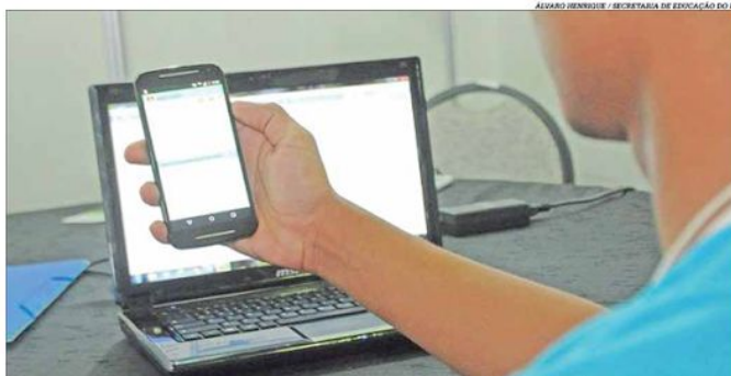
A transformação digital na educação ganhou força com a Covid-19 e intensificará o ensino a distância

Com as salas de aula desertas desde março devido às medidas de distanciamento social para evitar a propagação da Covid-19, as escolas foram obrigadas a investir mais em tecnologia para que os alunos possam manter os estudos por meio virtual. Entre as lições deixadas pela pandemia está a transformação digital, que intensifica o ensino a distância, com a presença imprescindível do professor no processo de aprendizagem. No futuro da educação, o modelo emergente será híbrido, conjugando a presença física e o universo on-line. Pág. 9