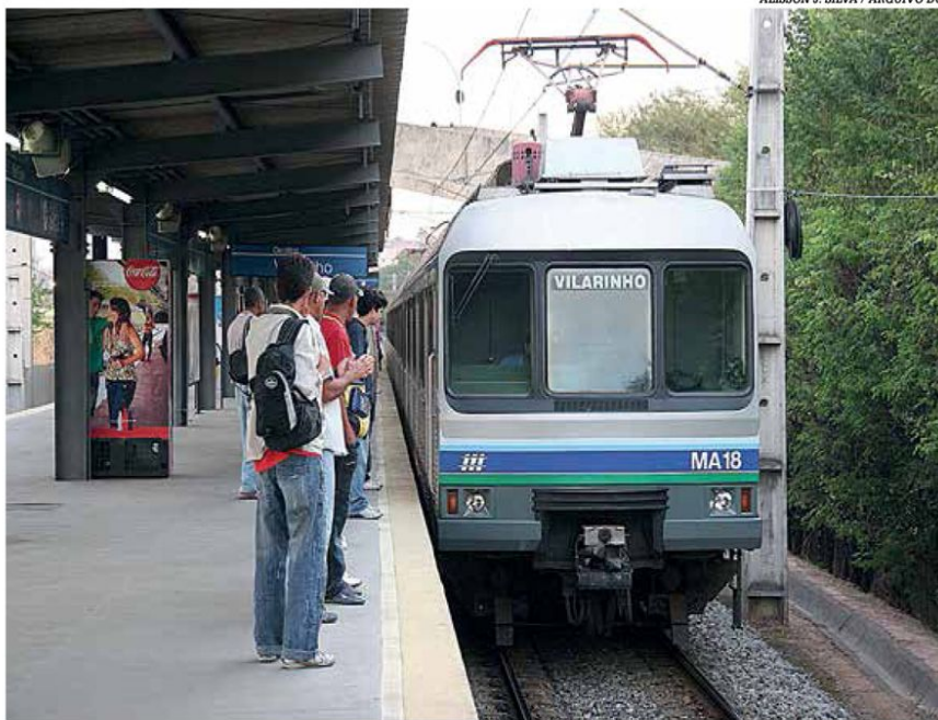
A CBTU-MG está na lista dos 115 ativos que serão destinados à iniciativa privada em 2021

"Pelo contrário, no projeto de lei da Eletrobras, tem recursos previstos especificamente para modernização do parque de energia do norte", disse. "Para além das questões de arrecadação que são relevantes, a agenda de privatização visa modernizar e agregar muitos investimentos nesses setores hoje carentes por estarem controlados por estatais, que dependem de aportes em