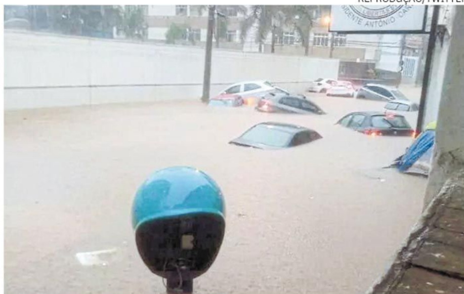
Diversos veículos ficaram debaixo d'água em bairros da cidade

O Corpo de Bombeiros ajudou a resgatar várias pessoas que estavam em situação de risco, mas ninguém ficou ferido, segundo a corporação.