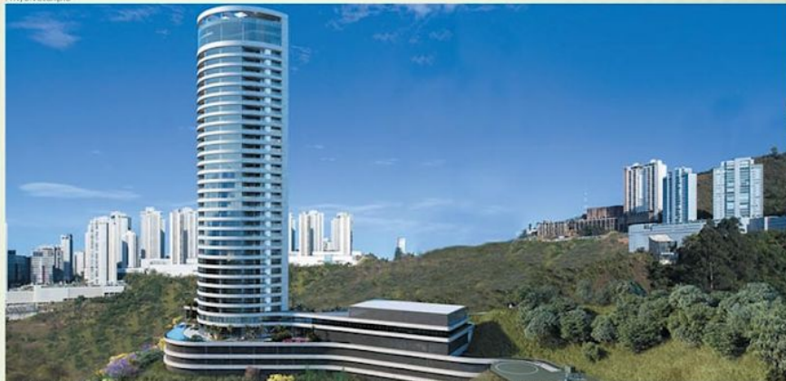
RECANTO DOS ABASTADOS—Divisa de BH e Nova Lima, endereço cobiçado por quem pode pagar por apartamentos de luxo