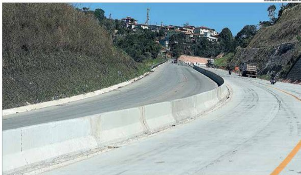
Projeto prevê que os recursos auferidos com a outorga devem ser destinados para obras em rodovias na região da concessão

O texto passou na forma do vencido em 1º turno, com a emenda nº 1 apresentada na Comissão de Transporte, Comunicação e Obras Públicas. A emenda suprime o artigo 3º do texto, que condicionava a