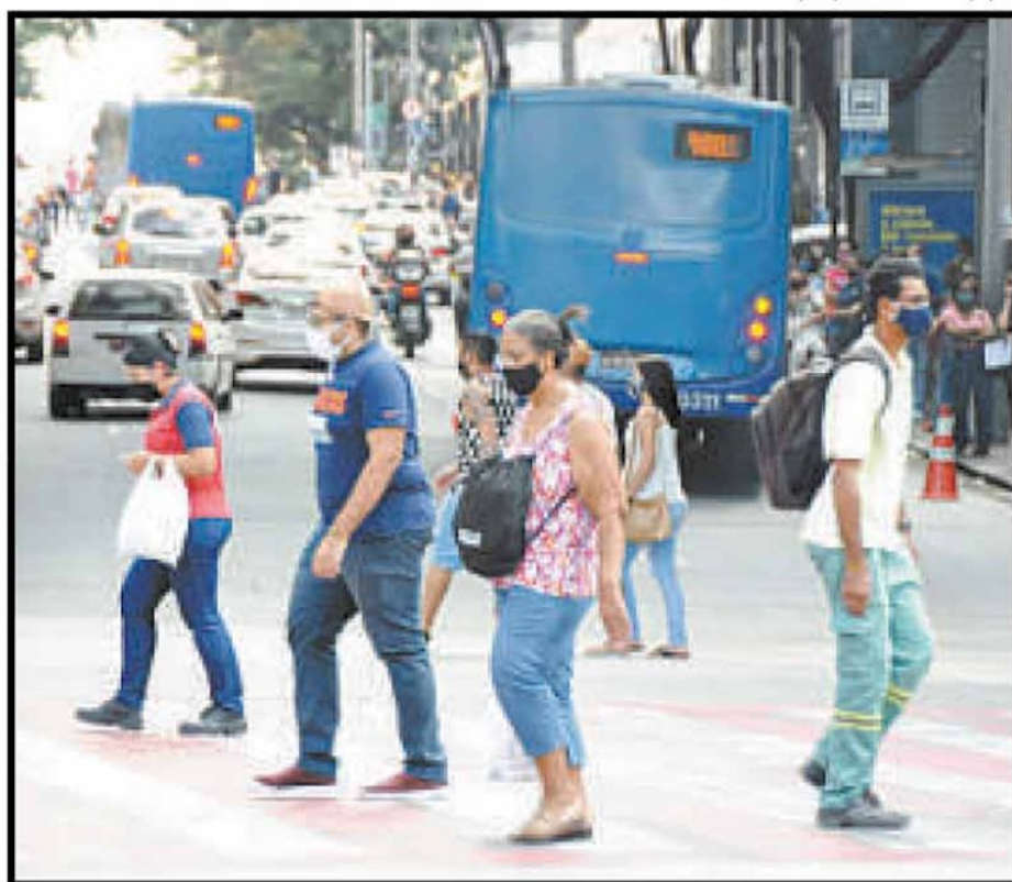
Movimento nas ruas da capital mineira: taxa de transmissão da COVID-19 e ocupação de leitos voltaram a subir na cidade

Apesar desses números, o ministro da Saúde, Eduardo Pazuello, minimizou o aumento de casos e citou um suposto baixo impacto das aglomerações causadas pelas eleições municipais. "Se todo o processo eleitoral dos municípios, com todas as campanhas, aglomerações e eventos, se isso não causa nenhum tipo de aumento de contaminação no nosso país, então, não se fala mais em afastamento social. Mas algum reflexo tem que ter tido", declarou o general durante uma audiência pública da comissão do Congresso Nacional que acompanha as ações do governo relacionadas à crise do novo coronavírus.