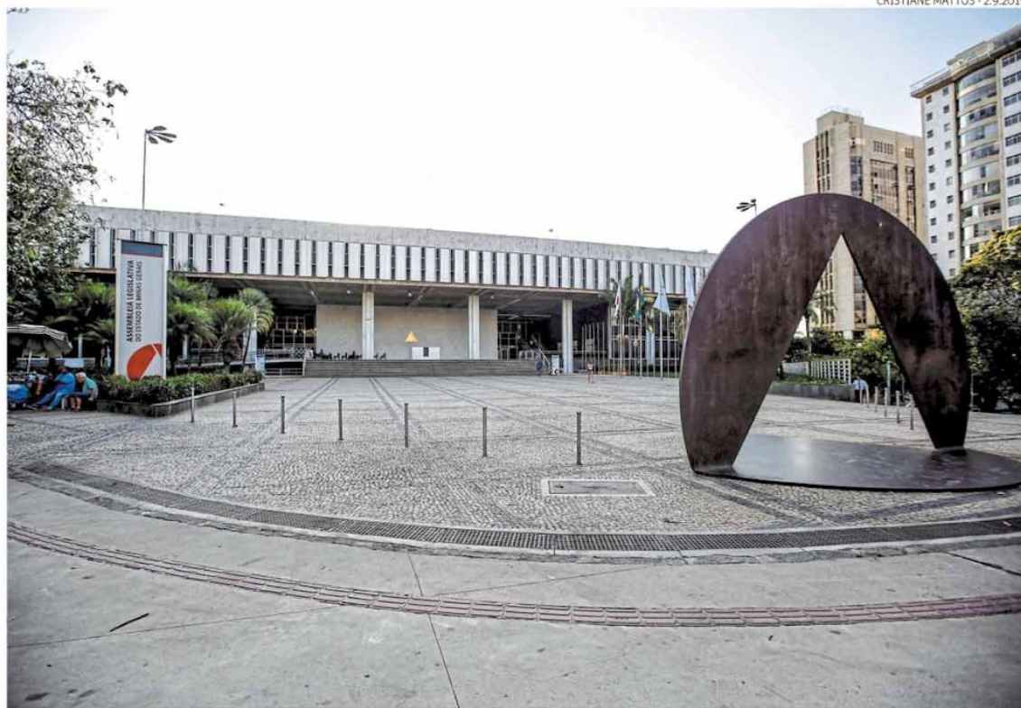
Limitação. Deputados estaduais retiram do governo do Estado autonomia para gerir recursos extraordinários do Orçamento

Em nota, o governo de Minas informou que “respeita a autonomia do Legislativo”.