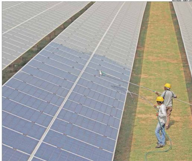
A Vale estima uma diminuição de US$ 70 milhões por ano nos custos de energia com a usina fotovoltaica

A Vale calcula uma redução anual de US$ 70 milhões nos custos de energia com o projeto. A usina deve produzir 193 megawatts médios (MWm) para as operações da mineradora por ano. Pág. 3