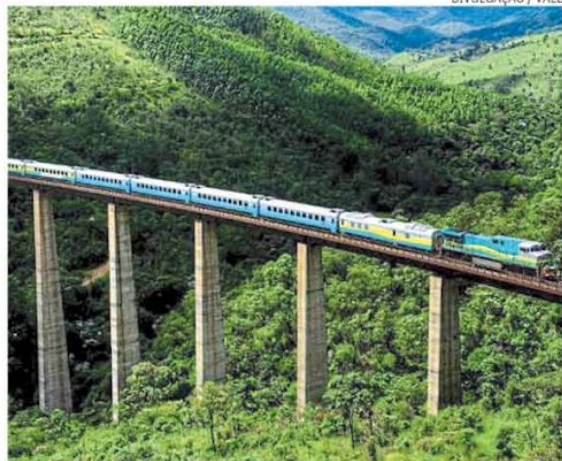
PEC tende a facilitar a entrada de verba privada no setor ferroviário