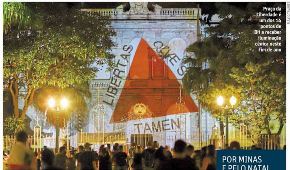
Praça da Liberdade é um dos 14 pontos de BH a receber iluminação cênica neste fim de ano