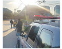
Veículos de seis linhas que operam na cidade foram acompanhados por viaturas da Guarda Municipal

nos três ataques os bandidos deixaram bilhetes e recados em que justificavam o ato como protesto por melhores condições nas prisões do estado.