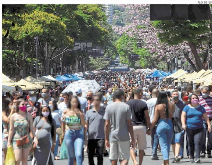
De volta. Público faz presença na Feira Híppie, que voltou a funcionar ontem; retorno foi marcado por protestos dos feirantes do setor de alimentação, que reclamaram da retirada de suas barracas da Afonso Pena. Página 12

Polícia registrou, entre janeiro e julho, 256 ocorrências de racismo ou injúria racial, mas vítimas afirmam que impunidade é alta. Página 27