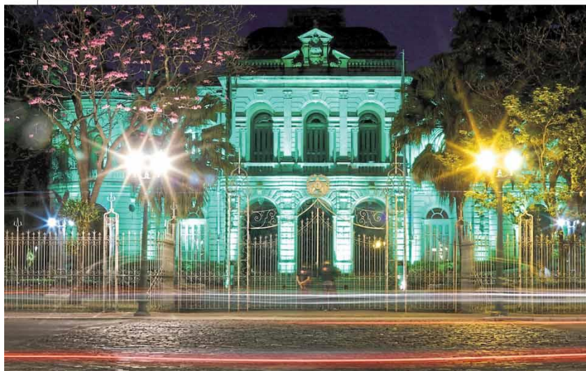
Sinal de respeito. Palácio da Liberdade ficará iluminado em verde até amanhã, numa homenagem do governo do Estado aos profissionais de saúde e às mais de 5.000 pessoas que morreram de Covid-19 no Estado até agora. Página 7

governo Zema previa que o menor percentual seria de 13%. Com essa mudança, 83% do funcionalismo público mineiro vai contribuir com índices de 11% a 12%. Página 3