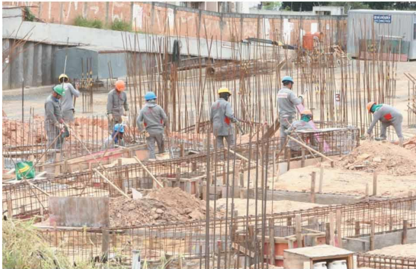
DESEMPENHO - Em Minas, construção civil só perdeu para a agropecuária, que teve saldo positivo de 9.819 vagas no mês passado

Construção civil criou 2.223 postos de trabalho em BH só em julho. Busca por imóveis, impulsionada por juros baixos e vendas on-line, surpreendeu o próprio setor e pode indicar bons ventos, enfim, na economia. PRIMEIRO PLANO - P.2