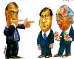
— Em vez de "Renda Brasil", que tal "Rendo-se Brasil"?