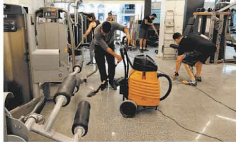
FUNCIONÁRIAS FAZIAM A LIMPEZA PARA REABERTURA DO BAR DA ESQUINA, NO CENTRO. DA MESMA FORMA, A ACADEMIA D2 FITNESS, TAMBÉM NA REGIÃO CENTRAL, HIGIENIZAVA INSTALAÇÕES E EQUIPAMENTOS