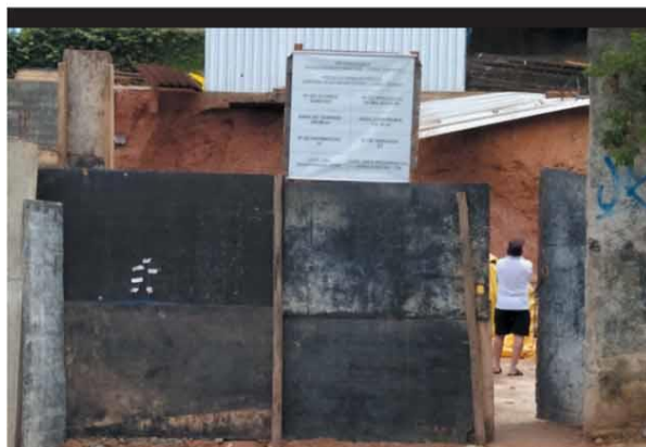
ESTRAGO – Muro de uma obra caiu no bairro Serra, após temporal de domingo: ninguém se feriu