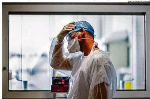
Médico francês ajusta seu equipamento de proteção. Continente concentrou 46% dos casos surgidos na semana passada, e mais países adotam toque de recolher. PÁGINA 26