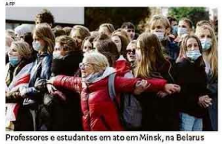
Professores e estudantes em ato em Minsk, na Belarus

Greve falha, e Belarus mantém repressão Movimento convocação pela oposição não conseguiu parar atividades, e ditador Lukashenko continua a reprimir e prender manifestantes, sem dar sinais de que cederá a pressões. A18