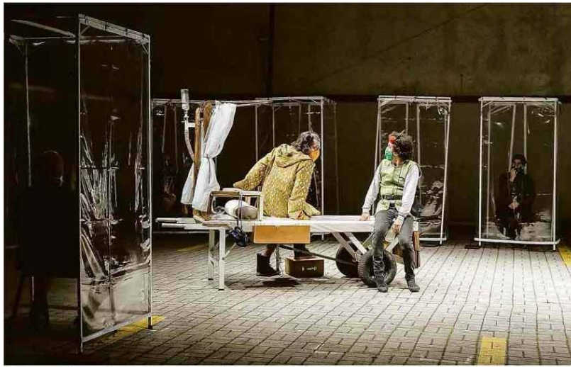
Cena do espetáculo 'Protocolo Volpone', da companhia Bendita Trupe, espectadores assistem à peça em cabines individuais para se proteger.

Matrículas mostram fuga de particulares e até das escolas Os pedidos de novas matrículas para pré-escola despencaram 56% na rede municipal de São Paulo, e 9% dos novos inscritos até setembro são egressos da rede particular — ante 35% em igual período de 2019. O movimento preocupa a gestão Bruno Covas (PSDB). Além da perda de renda das famílias, o fluxo atípico pode sinalizar um aumento abrupto do uso da capacidade do sistema, com eventual superlotação. O quadro sugere ainda a dívida de municípios de manter suas crianças na escola em meio à pandemia. COTIDIANO B2