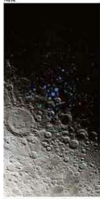
Regiões do polo Sul sem luz que podem preservar água

Ciência B6 Muito mais água na Lua A NASA divulgou dois estudos que demonstram para além de qualquer dúvida a presença de água na Lua — em regiões iluminadas pelo Sol. Resultados têm implicações importantes para futuras missões.