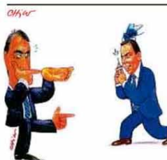
Próximo alvo: CoronaDórial

ros recebem 67% a mais que os trabalhadores da iniciativa privada. De acordo com informações do Banco Mundial em 53 países, essa vantagem, lá fora, é, em média, de 18%. O estudo, que reforça a importância da reforma administrativa, foi encaminhado ao governo, aos líderes partidários e aos presidentes da Câmara e do Senado. PÁGINA 28