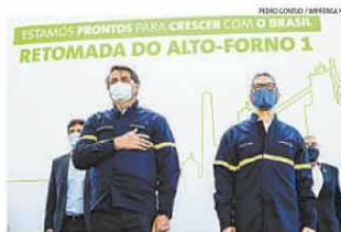
BOLSONARO PARTICIPOU DO EVENTO NA USIMINAS AO LADO DO GOVERNADOR ROMEU ZEMA

Em solenidade de reativação do alto-forno 1 da Usiminas, em Ipatinga, no Vale do Aço, o presidente Jair Bolsonaro descartou a proposta da equipe do ministro da Economia, Paulo Guedes, para o Renda Brasil, e declarou que o programa está suspenso. Ele quer uma nova formatação até amanhã. A principal insatisfação é com a ideia de transferir recursos de outros programas sociais, como o abono salarial, pago anualmente a trabalhadores que ganham até dois salários mínimos. "A proposta que a equipe econômica apresentou para mim não será enviada ao Parlamento. Não posso tirar de pobres para dar a paupérrimos", afirmou Bolsonaro.