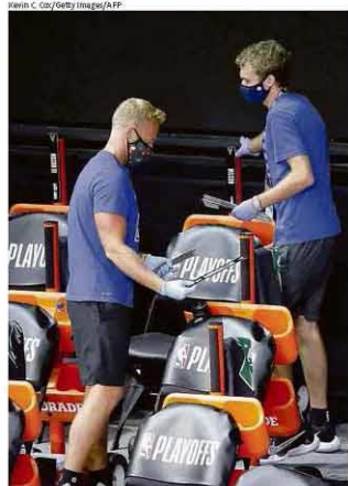
Nomes dos jogadores do Milwaukee são retirados do banco de reservas após o adiamento do jogo contra o Orlando

Um adolescente branco de 17 anos foi preso sob suspeita de dois assassinatos em protestos em Kenosha, Wisconsin. A cidade teve a terceira noite de manifestações após um homem negro ser baleado nas costas por policiais. Trump anunciou envio da Guarda Nacional. Mundo A12