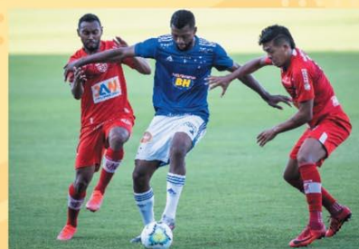
JEJUM – Cruzeiro completa três jogos seguidos sem vitória