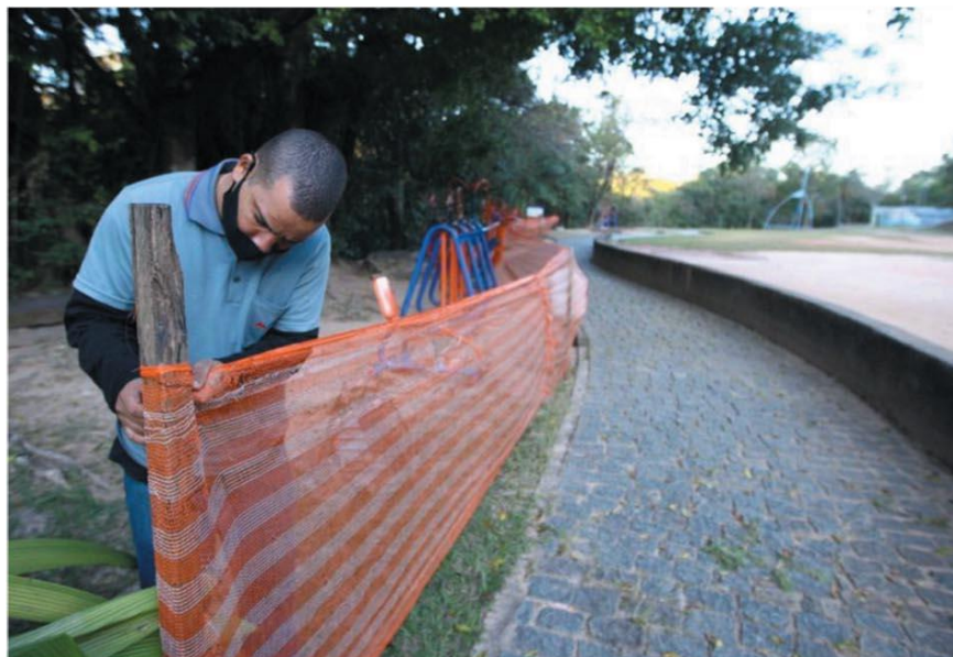
BARREIRA – No Parque Lagoa do Nado, telas de proteção foram instaladas para barrar o acesso aos aparelhos de ginástica

Seis importantes áreas verdes de BH, como o Municipal e o Mangabeiras, reabrem sábado, com restrições de uso e acesso só após agendamento. Distanciamento deve ser respeitado. HORIZONTES – P. 10