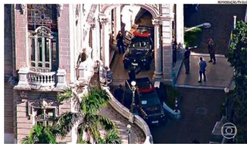
Busca e apreensão. Equipe da Polícia Federal em ação no Palácio Laranjeiras, residência oficial do governador