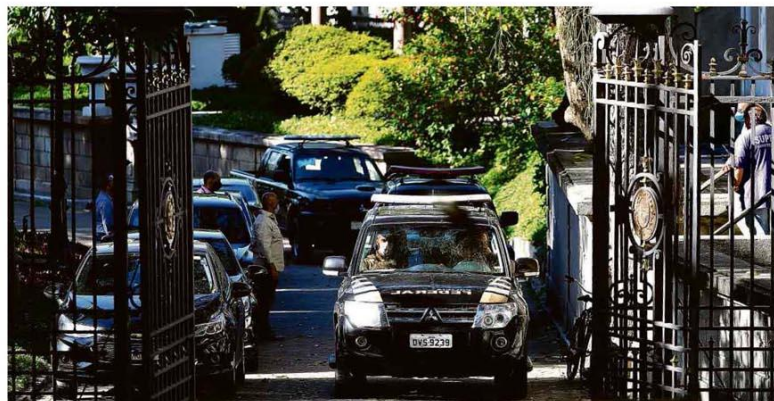
Polícia Federal deixa o Palácio das Laranjeiras após cumprimento de mandado de busca e apreensão contra o governador Wilson Witzel.

Uma guerra de anúncios entre ONGs ambientais e entidades da indústria e do agronegócio tomou conta dos jornais nos últimos dias após fala de Ricardo Salles (Meio Ambiente) sobre "passar a boiada" na reunião ministerial de 21 de abril. Mercado A18