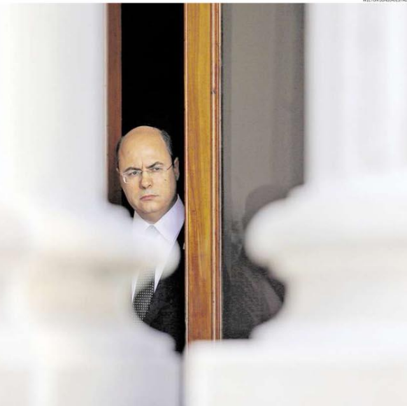
Palácio Laranjeiras. Witzel, na residência oficial após a operação; escritório da mulher também foi alvo de buscas

O governador do Rio, Wilson Witzel (PSC), foi alvo ontem de operação da PF sobre supostos desvios de recursos da Saúde. Com autorização do STJ, a PF entrou no Palácio Laranjeiras, residência oficial do governador, e apreendeu três celulares e três computadores. O escritório de Helena Witzel, mulher do governador, também sofreu buscas. O Ministério Público Federal vê "vínculo suspeito" entre o escritório da advogada e empresa investigada. O governador negou ter cometido irregularidades e atribuiu a operação a perseguição por parte de Jair Bolsonaro. Ao ser questionado sobre o caso, o presidente sorriu, deu "parabéns" à PF e negou ter interferido na investigação. Na segunda-feira, a deputada Carla Zambelli (PSL-SP) havia dito em entrevista que a PF estava prestes a deflagrar operações para investigar desvios de governadores na pandemia. Ela negou que tivesse recebido informações. POLÍTICA / PÁGS. A4 e A8