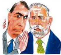
— Apuras, Aras?