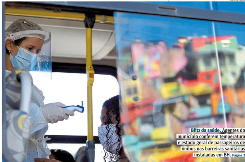
Blitz da saúde. Agentes do município conferem temperatura e estado geral de passageiros de ônibus nas barreiras sanitárias instaladas em BH. Página 2

CRISE FINANCEIRA E PAUSA NAS AUDIÊNCIAS AMEAÇAM AS PENSÕES ALIMENTÍCIAS. Página 10