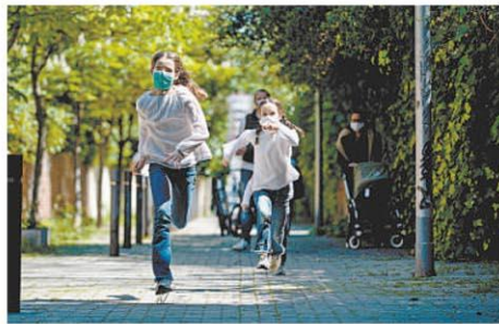
Em Barcelona, crianças de famílias diferentes precisam respeitar distância mínima de 2 metros