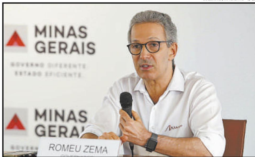
Romeu Zema comunicou data pelas redes sociais e disse trabalhar para "colocar a folha em dia"