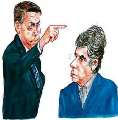
— Então já sabe, não pode passar dessa altura, talquê? —