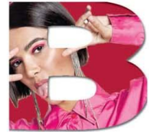
MONTAGEM SOBRE FOTOS SUBSCRITIVAS

■ Médicos, enfermeiros e técnicos têm suas vidas transformadas pelo distanciamento forçado de suas famílias, pela apreensão com o contágio e pela desinformação do público. Páginas 6 e 7