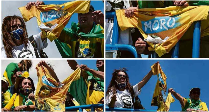
Manifestantes em Brasília colocam fogo em camiseta com imagem do ex-ministro Sergio Moro; protesto teve gritos contra o STF.