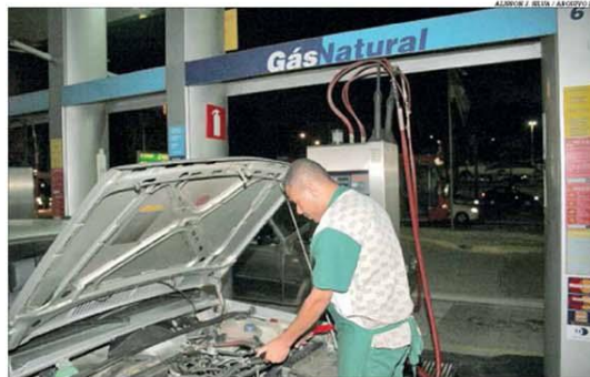
O preço do gás natural veicular (GNV) foi reduzido em 5,95% nos postos de Minas Gerais

Coronavírus x empresas (Milton Rui Jaworski)