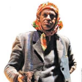
Festival Redemoinho de Histórias acontece pelo Instagram e promete entreter adultos amanhã e a meninada no domingo, a partir das 16h. Veja detalhes.