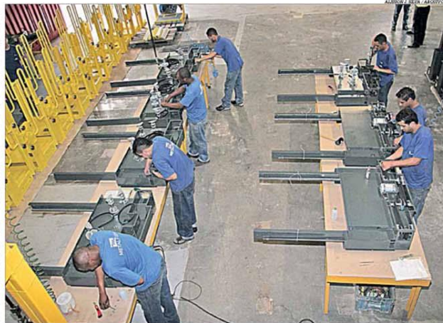
Com 30 dias de inatividade na economia, a projeção da Fiemg é de queda de 10% no PIB de Minas Gerais

Um estudo da Fiemg estima uma retração de 10% no Produto Interno Bruto (PIB) mineiro e perda de 2 milhões de postos de trabalho em 30 dias de inatividade provocada pela propagação do novo coronavírus. Para adotar medidas para atenuar os impactos no Estado, o governo de Minas Gerais criou um comitê para acompanhar a evolução do quadro fiscal e econômico. O grupo será formado pelas secretarias da Fazenda, Geral, Desenvolvimento Econômico, Governo, Infraestrutura e Mobilidade e Planejamento e Gestão; BDMG, Fundação João Pinheiro (FJP) e Indú. Conforme o levantamento da Fiemg, no caso de paralisação de 60 dias, a projeção de queda do PIB mineiro é de 19% e os postos de trabalho perdidos poderão chegar a 3,6 milhões. Já considerando 90 dias de ociosidade, as estimativas são de -27,6% e -4,9 milhões, respectivamente. Pág. 4