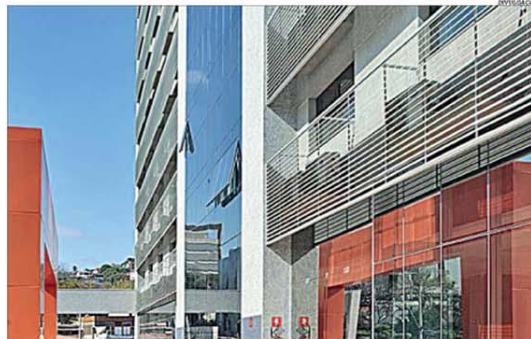
O fechamento temporário já provocou o desligamento de 30% dos funcionários dos hotéis

Enquanto os casos de contaminação avançam, numa progressão que assusta, crescem também com velocidade o número de casos que demandam internação hospitalar. Uma situação que já é bastante difícil e, no Brasil, ainda não atingiu o momento crítico. Quem conhece e é capaz de interpretar a evolução do coronavírus em países como China e Itália, estima que no Brasil o pico da pandemia ocorrerá entre os meses de abril e maio. Por horas, e numa condição que por outros motivos já é crítica, o fundamental, como vem sendo feito, é garantir o isolamento social e dessa forma o avanço das contaminações até um ponto incontrolável, fora da capacidade de atendimento do sistema de saúde. "Especuladores são criminosos", pág. 2