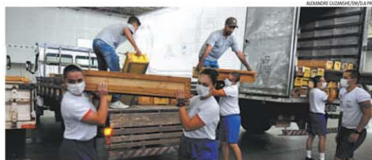
'HOSPITAL' EXPOMINAS / Maior local de exposições de BH começou a receber equipamentos médicos que vão transformar o espaço de 18 mil metros quadrados no Bairro Gameleira em um hospital de campanha. Serão ao menos 60 toneladas de aparelhos para a obra de adaptação, que deve durar uma semana. A Secretaria Estadual de Saúde vai instalar 800 leitos para pacientes em estado mais grave e outros 100 para os demais. Parte dos recursos para a intervenção emergencial virá da Federação das Indústrias de Minas Gerais (Fiemg). PÁGINA 2

BIOGRAFIAS PARA DIAS DE QUARENTENA PENSAR, PÁGINAS 2 E 3