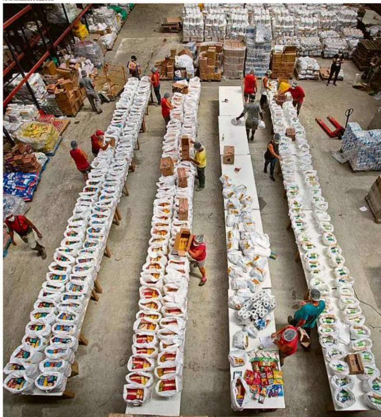
Enquanto medidas anunciadas por autoridades não saem do papel, cresce a rede de solidariedade para ajudar mais de 650 mil pessoas que vivem em extrema pobreza no Rio. Numa empresa que monta cestas básicas, em Duque de Caxias (foto), pedidos subiram 50%. A frente Rio contra o Corona já distribuiu 72 toneladas de alimentos. PÁGINA 11