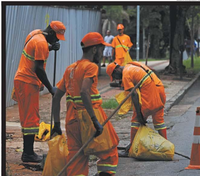
Coleta de lixo e limpeza de áreas públicas na capital mineira contam com 3 mil garis em BH. Somente coleta seletiva foi interrompida