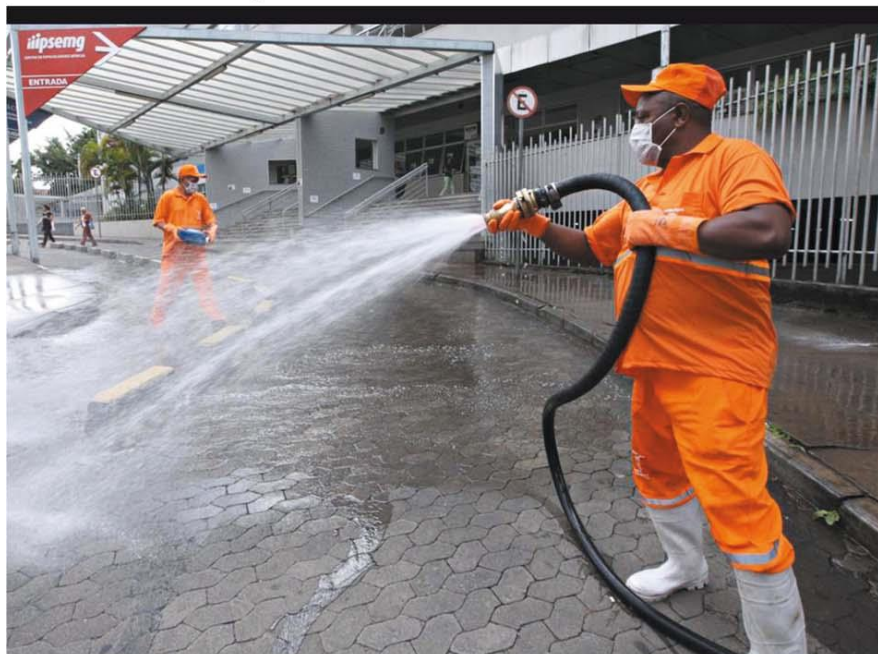
FAXINA Cloro, sabão, água e desinfetante são usados na limpeza de calçadas de BH como parte das ações para eliminar o novo coronavírus. Serviço está sendo executado pela SLU em pontos estratégicos da capital, como o entorno de hospitais.

Comerciantes preveem retração na venda de peixes devido à Covid-19. Quem fabrica chocolates teme ficar com o estoque parado, e até rituais religiosos seculares serão feitos sem fiéis. PRIMEIRO PLANO - P.2 E 3