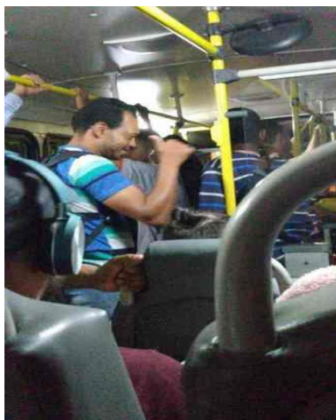
Ônibus da linha 301C estava lotado no final da tarde desta quarta-feira

postado em 26/03/2020 15:32 / atualizado em 26/03/2020 18:39