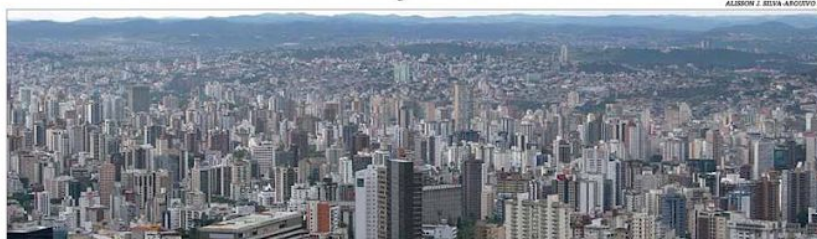
Os preços médios dos imóveis comerciais recuaram na Capital, tanto para venda quanto para locação, aponta o Índice FipeZap

Belo Horizonte registra queda nos preços médios de imóveis comerciais para venda e locação. No acumulado do ano, de acordo com o Índice FipeZap Comercial, a retração na comercialização chegou a 2,51% e, nos últimos 12 meses, a 2,72%. Em outubro na comparação com setembro, houve recuo de 0,60%. Já o valor médio da locação de imóveis comerciais na capital mineira caiu 0,75% em outubro frente ao mês anterior, a segunda maior entre as cidades pesquisadas. De janeiro a outubro, a variação nos preços dos aluguéis comerciais ficou quase estável (0,14%) e no acumulado dos últimos 12 meses, em 0,30%. Pág. 6