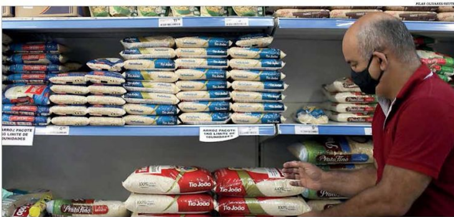
O grupo de alimentação, liderado por arroz, óleo de soja e proteínas, registrou alta de preços de 2,47% em novembro na RMBH, conforme o IPCA-15

Para os bares e restaurantes, o impacto é maior pela dificuldade de repasse imediato da elevação nos custos no momento em que o movimento de consumidores está fraco, assim como nos hotéis. Págs. 3 e 4