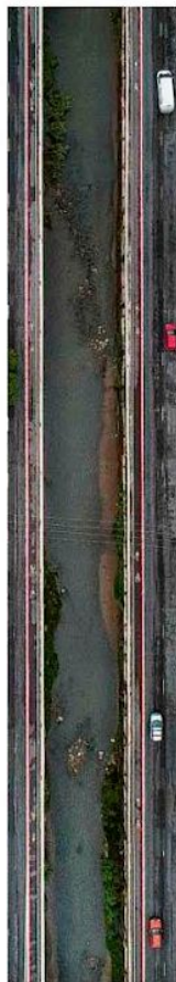
Córrego Ipiranga, em São Paulo; capital gasta apenas 64% da verba de combate a enchentes B4

Grupos na rua Cesário Mota Júnior, Vila Guarani, na noite de sexta (20); pessoas têm sido flagradas nas redondezas de bares e boates sem máscara. Cotidiano B7