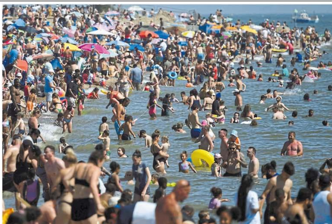
Descontrole. Com dias de calor atípico, população da Inglaterra corre para a praia; técnicos alertam o governo de que aglomerações criadas pela rápida reabertura podem gerar segunda onda de Covid. Página 10

Com os traficantes, polícia apreendeu haxixe e insumo para produção de ecstasy. Chefão ainda é procurado. Página 19