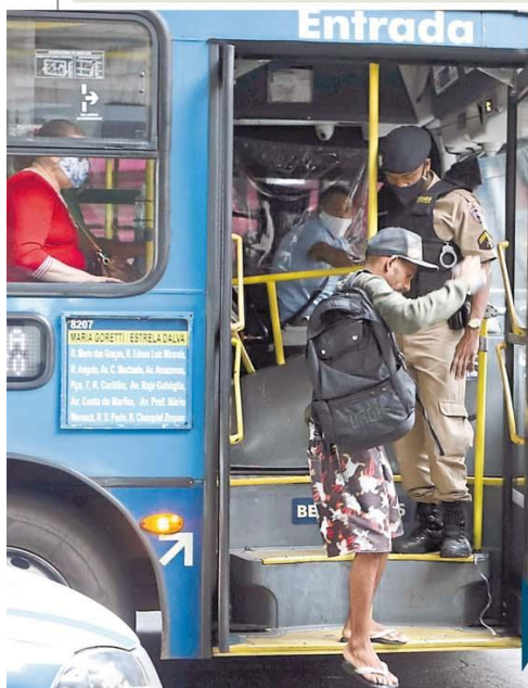
Polícia Militar vai reforçar, nas ruas, a obrigatoriedade do uso de máscaras

Saúde. Hoje, 84% dos CTIs e 70% das enfermarias estão cheios