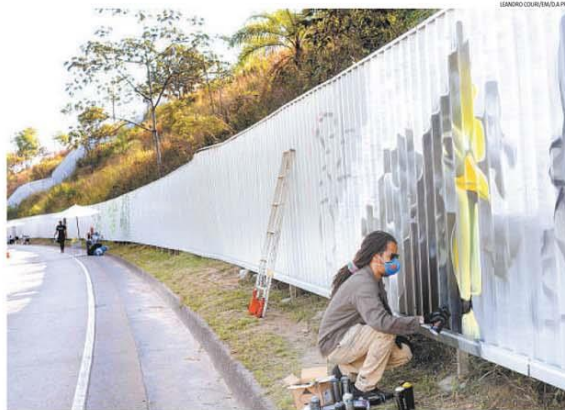
DA COR DO GALO / O preto e branco ainda não tem data para invadir as arquibancadas, mas os símbolos do Atlético já tomam conta do entorno das obras da Arena MRV, o novo estádio do time, no Bairro Califórnia, em BH. Artistas começaram a preencher com grafites os tapumes que contornam o terreno (foto), retratando ídolos, conquistas, torcedores, escudo e mascote. Predominam, além dos tons alvinegros, o amarelo e o dourado. PÁGINA 16

Em meio à constatação de que o número de óbitos ganha velocidade em cidades do interior, o Ministério da Saúde comprou ontem o segundo maior aumento no registro de infectados pela COVID-19: 42.725 novos casos em 24 horas. Autoridades nacionais recuaram no prognóstico de que o quadro parecia caminhar para a estabilização, enquanto o país se manteve acima dos 1 mil óbitos diários, com 1.185 vidas perdidas. PÁGINA 6