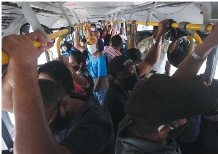
DISTANCIAMENTO? — Ônibus em BH, ontem: se não fossem as máscaras, cena seria típica de um dia qualquer antes da pandemia

Avanço da doença levou metroviários a reduzir horários na capital. Com menos opção, passageiros são "empurrados" para os coletivos lotados. Aglomeração nas filas e dentro do transporte público faz crescer chance de contágio. HORIZONTES — P.10