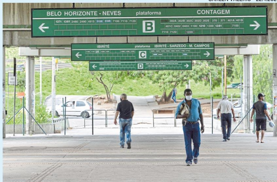
■ Usuários do metrô precisam usar máscaras nos vagões e também nas estações