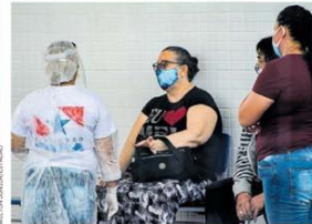
Pará. Parentes reclamam de falta de informação