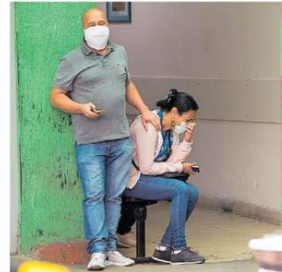
Grande SP. Pelo menos 13 hospitais estão lotados