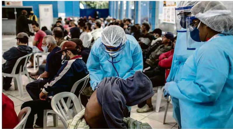
Equipe da Médicos Sem Fronteiras, especializada em áreas de conflito, atende morador de rua com suspeita de Covid-19 na Barra Funda (SP)