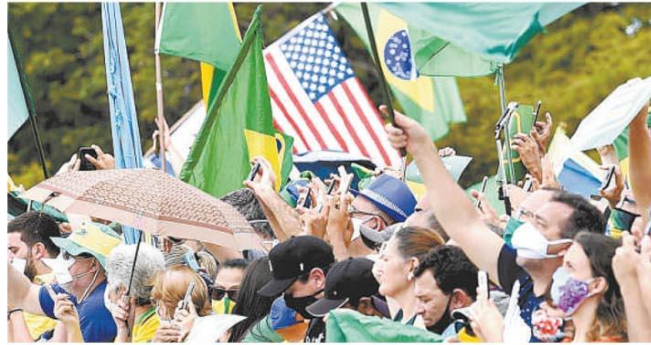
APOIO AO PRESIDENTE Manifestantes voltaram a se aglomerar em frente ao Palácio do Planalto, em Brasília, onde foram cumprimentados por Jair Bolsonaro