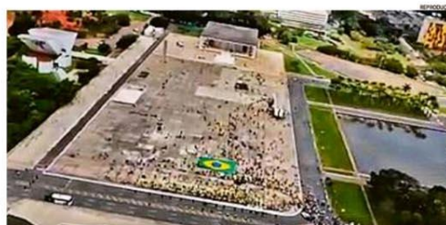
Imagem do vídeo divulgado pelo presidente Jair Bolsonaro mostra manifestantes na Praça dos Três Poderes em mais um domingo de atos governistas. Mesmo em número menor, apoiadores fizeram aglomerações e chegaram perto do presidente, que foi sem máscara e usou um helicóptero para sobrevoar a manifestação. O ministro interino da Saúde, Eduardo Pazuello, participou do ato. PÁGINA 4