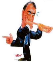
— Quem tem hemorróida tem medo!