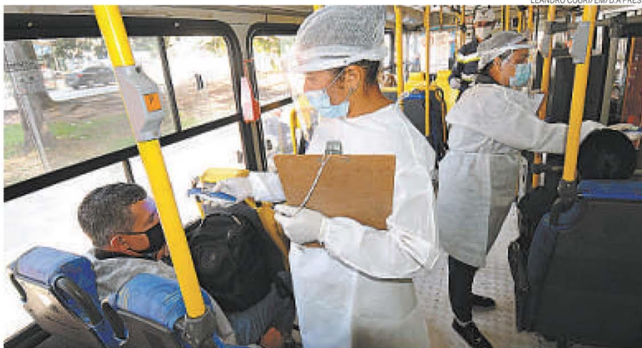
Agentes que trabalham na barreira sanitária entraram nos coletivos e aferiu a temperatura dos usuários