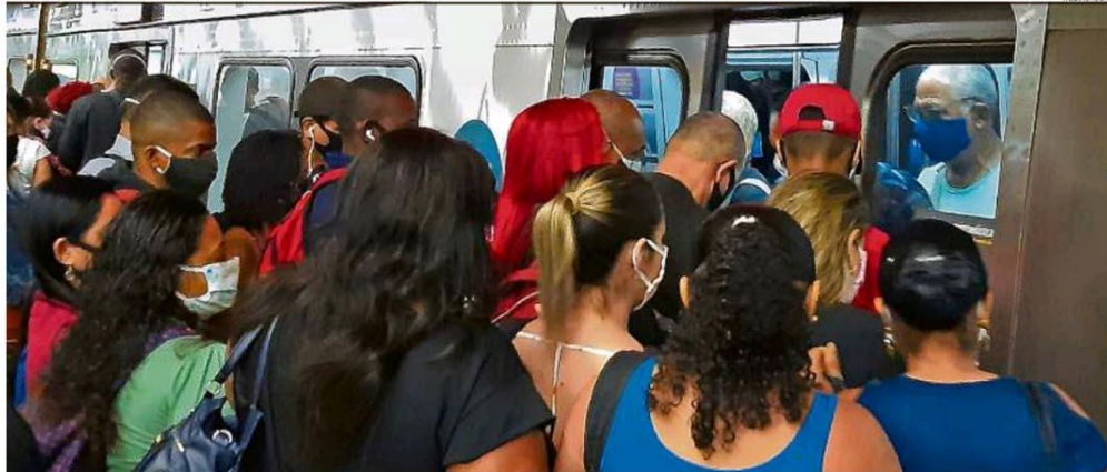
Superlotados. Após a adoção das medidas de flexibilização, a aglomeração de passageiros nos transportes públicos, como o metrô, tornou-se uma cena corriqueira, preocupando especialistas, que temem por nova onda da doença

RIO DE JANEIRO, QUARTA-FEIRA, 24 DE JUNHO DE 2020 ANO XCIV - Nº 31.723 - PREÇO DESTA EXEMPLAR NO RJ - R$ 5,00 2ª EDIÇÃO