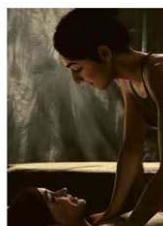
O casal Ellie e Dina no jogo 'The Last of Us Part 2'. Raportville