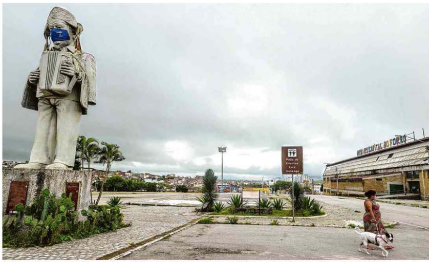
Estátua de Luiz Gonzaga de máscara em Caruaru (PE), que, ao lado de Campina Grande (PB), tem perda estimada em R$ 400 mi sem festividades. Luc Collet/FotoPress

O número de brasileiros barrados na entrada de Portugal em 2019 bateu recorde, com um aumento de 37,4% em comparação aos números de 2018. A10