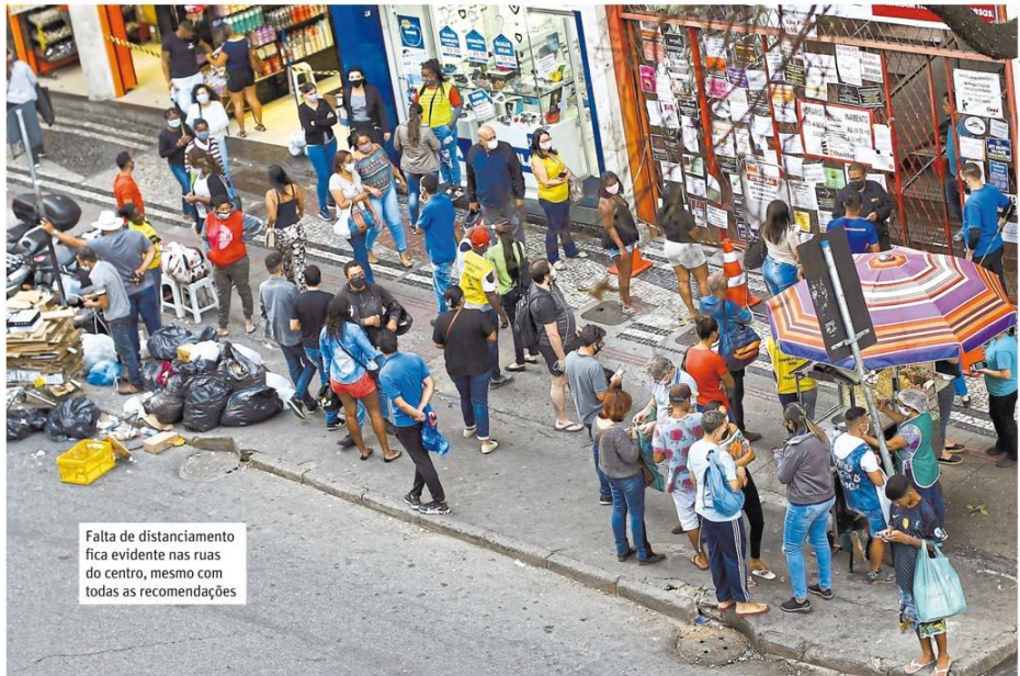
Falta de distanciamento fica evidente nas ruas do centro, mesmo com todas as recomendações

Pandemia. Infectologista diz que comércio deve ficar como está, mas não descarta retroagir