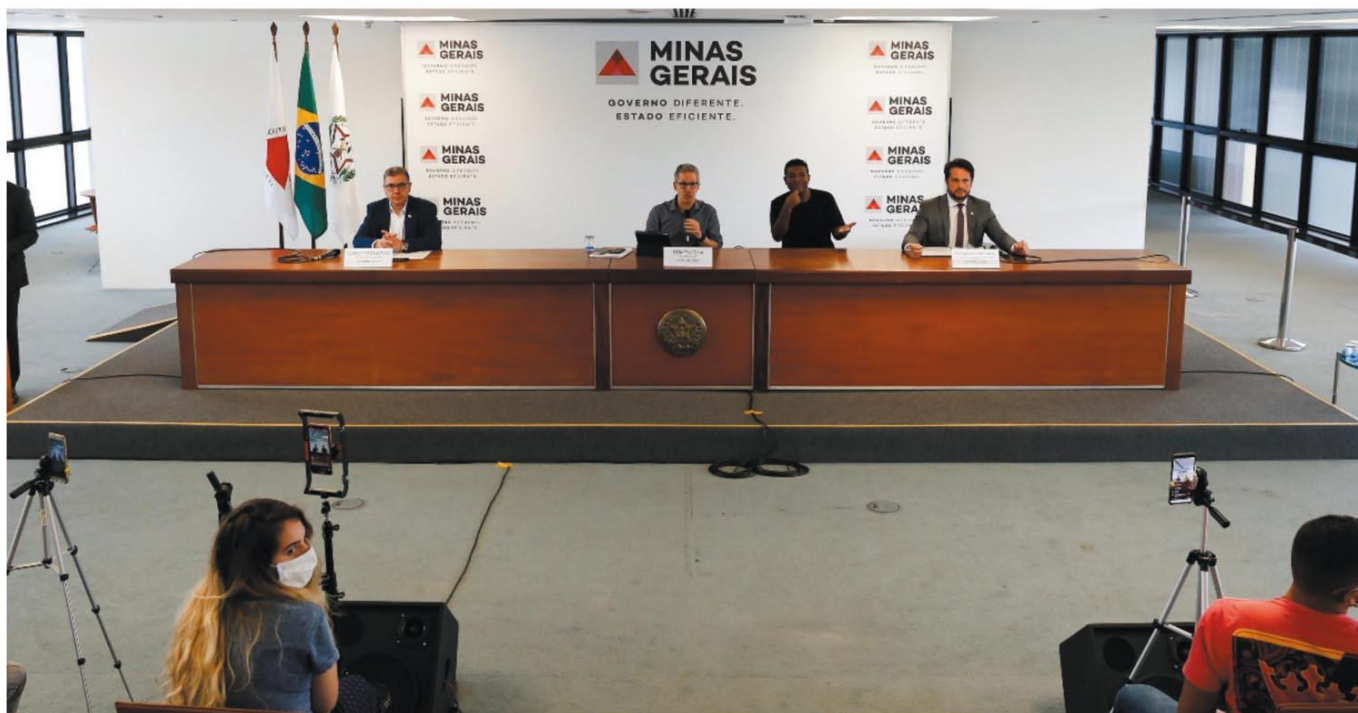
“MINAS CONSCIENTE” – Segundo o governador Romeu Zema haverá o protocolo básico, comum a todos, e os específicos, que guiarão de maneira segura os empresários e os consumidores

A partir da próxima segunda-feira os protocolos serão disponibilizados por meio do endereço eletrônico saude.mg.gov.br/coronavirus