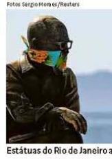
Estátuas do Rio de Janeiro amanheceram com máscaras ontem, quando o uso do acessório passou a ser obrigatório na cidade

Cerca de dois milhões de trabalhadores já tiveram contrato suspenso por até dois meses, e 1,3 milhão, salários e jornadas reduzidos. A maior parte teve corte de 50% ou mais dos vencimentos. Os acordos foram liberados por MP durante a crise. mercado A15