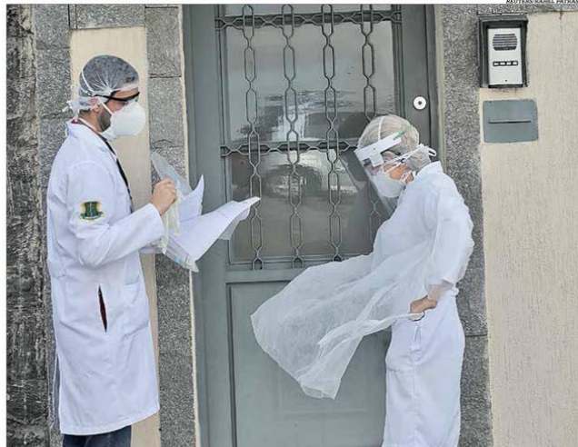
A pandemia do coronavírus obriga uma retomada gradual da economia com protocolos sanitários

O programa sugere a retomada gradual de comércio, serviços e outros setores, adotando protocolos sanitários, divididos por segmentos, para garantir a segurança da população. Págs. 18, 19 e 20