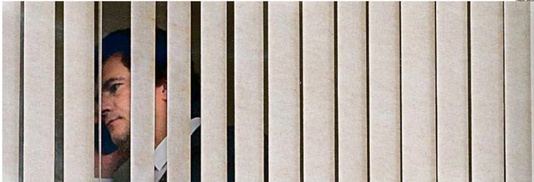
Troca. O ministro Sergio Moro faz a ao telefone em seu gabinete. Um dos nomes cogitados por Bolsonaro para comandar a PF é o de egado Anderson Torres, secretário de Segurança Pública do DF. Movimento é visto como aceno ao Centro

Em meio ao combate à pandemia do coronavírus, o presidente Jair Bolsonaro, que tenta uma aproximação com partidos do Centrão, comunicou ontem ao ministro Sergio Moro