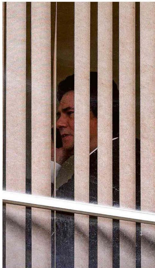
Sergio Moro fala ao telefone em seu gabinete, ontem à tarde, em Brasília.

O colapso na rede de saúde de Manaus tem feito com que pacientes de Covid-19 levados pelo Samu sejam recusados nos hospitais por falta de vagas ou aceitos se o serviço de emergência ceder maca e cilindro de oxigênio. Em Belém, com UTIs lotadas, doentes morrem antes de internação. saúde B4