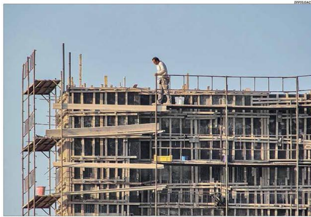
O indicador de confiança da construção atingiu os patamares da recessão econômica de 2015 e 2016

O Índice de Confiança do Empresário da Indústria da Construção de Minas Gerais (Icicon-MG) caiu 21 pontos em abril frente a março, sob impacto da crise econômica provocada pelo novo coronavírus e as incertezas sobre o controle da pandemia e os rumos do mercado. Com 34,1 pontos, o indicador foi o menor de toda a série histórica e reforçou mostrar o pessimismo dos construtores mineiros em relação à situação econômica do País, de Minas e das próprias empresas, ao ficar bastante abaixo da linha dos 50 pontos. A confiança retrocedeu aos patamares verificados durante a recessão econômica de 2015 e 2016. Pág. 9