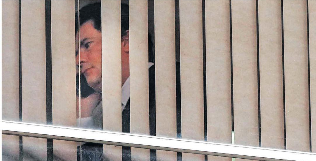
Crise. Fontes dizem que relação entre Sérgio Moro e o presidente Bolsonaro vem se deteriorando; possível saída do ministro mais popular provocou fortes reações nos três Poderes