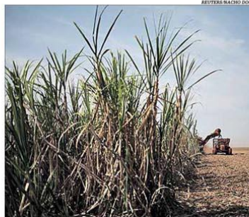
O clima favorável estimulou a safra de cana-de-açúcar

Mesmo com a redução de 3,2% na área plantada, o clima mais favorável na safra 2019/20 aumentou em 8,7% a produção de cana-de-açúcar em Minas Gerais sobre o período anterior, diz a Conab. O volume chegou a 68,7 milhões de toneladas. A demanda direcionou a maior parte da cana para o etanol, que atingiu 3,59 bilhões de litros, com alta de 10,9%. A produção de açúcar somou 3,1 milhões de toneladas, avanço de 4,2%. Pág. 22