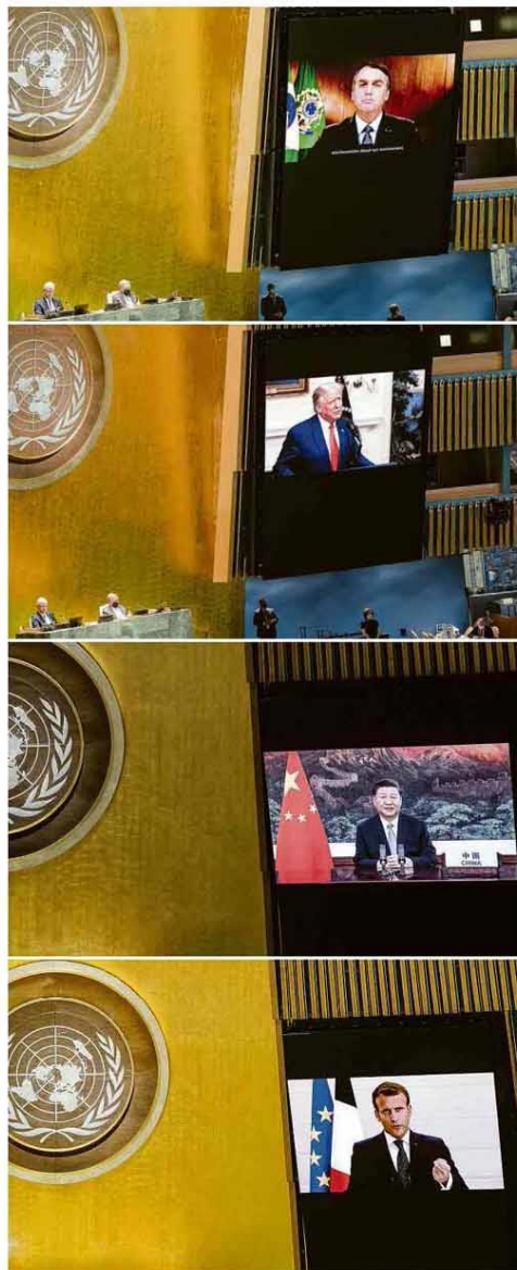
Jair Bolsonaro, Donald Trump, Xi Jinping e Emmanuel Macron têm seus discursos exibidos em tela na sede das Nações Unidas esvaziada pela pandemia de coronavírus, em Nova York

Ao abrir Assembleia Geral virtual, presidente reafirma que é vítima de campanha de desinformação