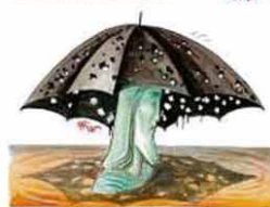
— Poderia ser pior... poderia chover!