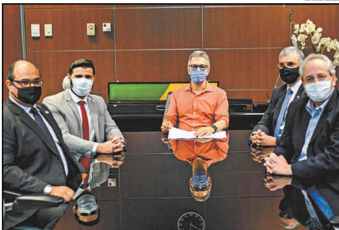
Governador Romeu Zema postou foto com seus auxiliares nas redes sociais, após sancionar a reforma da Previdência estadual