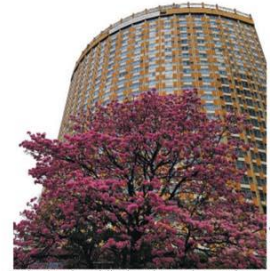
O destino do prédio do Othon Palace pode ser decidido em 6 de outubro. É quando acontece o leilão on-line do imóvel cravado no coração de BH. Lance mínimo é de R$ 30 milhões.

HOJEEEMDIA.COM.BR - ANO XXXII - Nº 11.424 ASSINATURA/RELACIONAMENTO COM O ASSINANTE: (31) 3236-8000 - HOJEEEMDIA.COM.BR/ASSINE WHATSAPP: (31) 98497-0510 - E-MAIL: ATENDIMENTO@HOJEEEMDIA.COM.BR