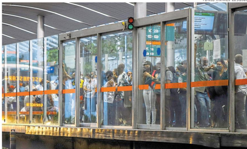
Transporte. Estação do Move, no centro de Belo Horizonte, lotada de usuários à espera de ônibus

“No Brasil como um todo, o transporte público está cada vez mais precarizado, com uma tendência de redu-