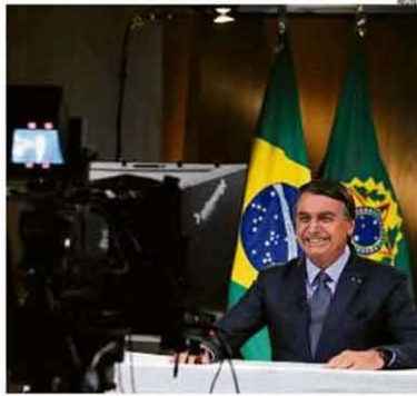
Bastidores. Bolsonaro sorri durante a gravação do discurso para a Assembleia da ONU

O Brasil vem perdendo atratividade para os investidores estrangeiros em função da crise global, das incertezas em relação aos gastos públicos futuros e do avanço das queimadas e do desmatamento. Nos primeiros oito meses deste ano, US$ 15,2 bilhões deixaram o país, o maior volume da série histórica, que começou em 1982. Os investidores estrangeiros ainda retiraram R$ 87 bilhões da Bolsa até o último dia 17, a maior saída desde 2008. PÁGINA 19