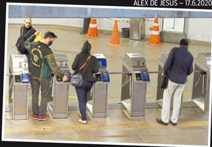
■ Atendimento ficará restrito aos horários de pico

A CBTU não respondeu à reportagem até o fechamento desta edição (Gabriel Moraes)