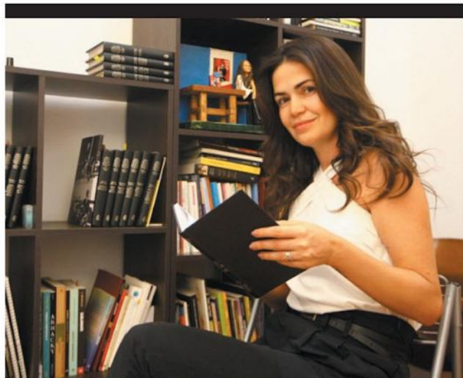
DEMOLINARI - Leitor vai poder descobrir que talvez esteja "dormindo com o inimigo"