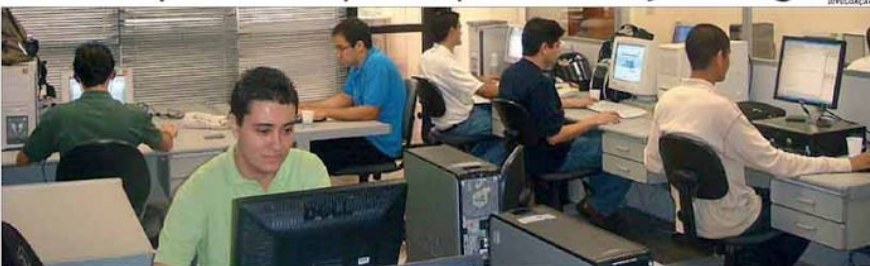
Com a incorporação da Just Digital, o Grupo Squadra já acumula três aquisições nos últimos 18 meses, além de parcerias estratégicas

Em busca de expansão no mercado paulista como trampolim para ultrapassar as fronteiras do Brasil, o Grupo Squadra anunciou a aquisição da Just Digital, grupo especializado em design e experiência de produtos e serviços digitais. O valor do investimento não foi revelado. A compra da empresa paulistana faz com que o Grupo Squadra ultrapasse a marca de 600 colaboradores. Foi a terceira aquisição do grupo nos últimos 18 meses. A Squadra tem feito parcerias com empresas líderes de mercado para o lançamento de soluções completas para setores específicos. Pág. 9