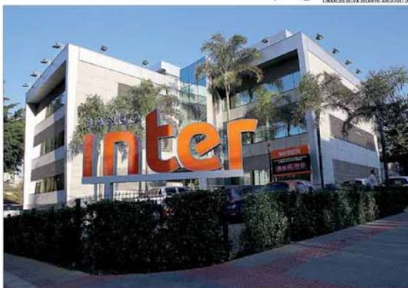
O Banco Inter fez aporte de R$ 90 milhões para adquirir participação de 45% na Granito

Para ingressar no mercado de aquisição, o Banco Inter fechou acordo para a aquisição de 45% da Granito, empresa especializada em meios de pagamento, com um investimento de R$ 90 milhões na companhia. A expectativa, caso a negociação seja aprovada pelos órgãos regulatórios, é ampliar os serviços oferecidos às empresas clientes. Com 45% do capital social da empresa, o Inter passará a ser sócio do Banco BMC, que terá 45% de participação, e os executivos da Granito ficarão com os 10% restantes. Pág. 5