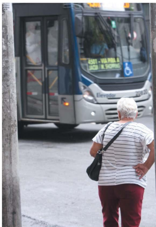
FIQUE EM CASA - Decreto da PBH limita horários em que idosos podem usar gratuidade a quem têm direito em ônibus

fiscalização intensa quanto ao uso de equipamentos de proteção nos veículos e implantação da capacidade reduzida de passageiros nos ônibus e metrô.