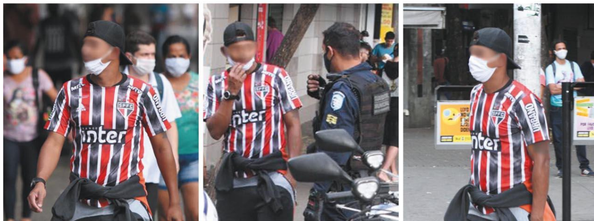
DIÁLOGO - Estratégia da prefeitura é orientar belo-horizontinos a incorporar a máscara ao dia a dia, da maneira correta; acima, guardas convencem rapaz a usar proteção cobrindo também o nariz