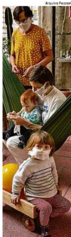
Família veste máscaras para se proteger em São Paulo