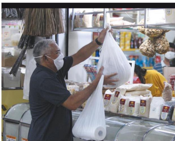
QUASE VAZIO - Fechamento de parte das lojas e ordem de isolamento fizeram público cair 80%

Férias coletivas de equipes de apoio e jogadores terminam em 30 de abril e reativação do calendário aconteceria em maio. Se a retomada dos jogos vingar, Coelho, Galo e Raposa precisariam de uma intertemporada. ESPORTES - P.11