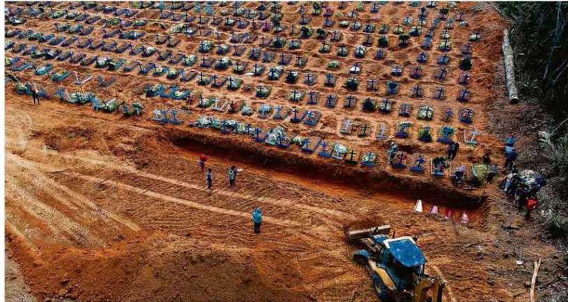
Caiões em vala comum ontem em cemitério de Manaus; cada sepultamento só pôde ser acompanhado por cinco familiares.