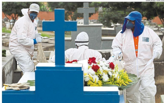
Despedida solitária. Corpo da técnica de enfermagem que foi a primeira vítima da Covid-19 em Contagem foi enterrado ontem; por segurança, não houve cortejo, parentes ou amigos presentes. Página 3

do lado de fora. Empresas que descumprirem a norma podem ser multadas. A máscara já é exigida em 18 cidades da região metropolitana. Páginas 2 e 3