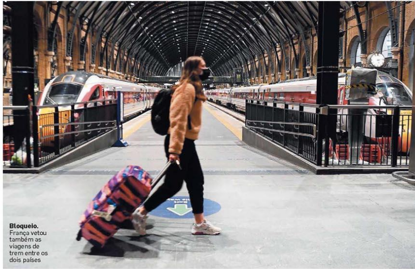
Bloqueio. França vetou também as viagens de trem entre os dois países