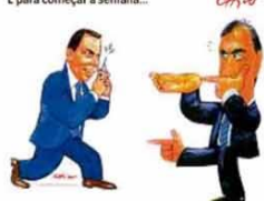
— Segue o baile