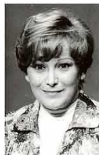
A atriz Nicette Bruno em 1979. 12 mai 1979