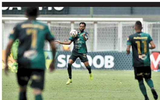
AMÉRICA Prejudicado mais uma vez pela arbitragem, América fica no empate em 2 a 2 com a líder Chapecoense, no Independência. ESPORTES - P.13