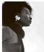
Modelo em desfile da Yves Saint Laurent.

Atriz de TV e de teatro morre após passar quase 1 mês internada com Covid