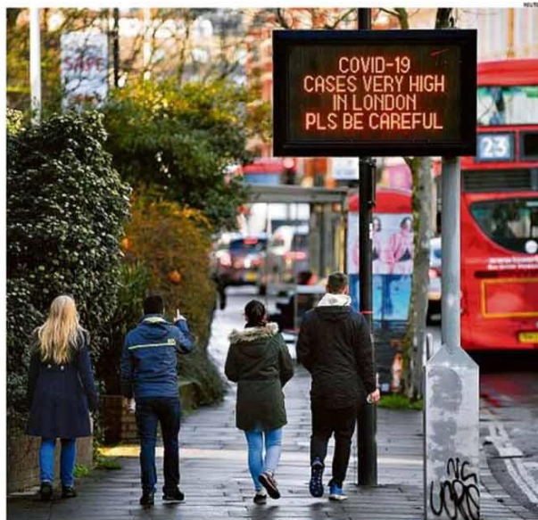
Vários países europeus, inclusive França e Itália, decidiram suspender viagens do e para o Reino Unido para conter a disseminação de variante do coronavírus que é mais contagiosa. Londres (foto) entrou em quarentena total. PÁGINA 21

Variante do coronavírus se espalha, e Reino Unido se isola