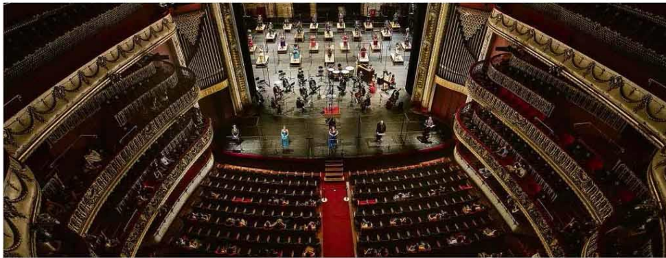
DEPOIS DE NOVE MESES, O APLAUSO DISTANCIADO

De máscara e sob regras de separação, platéia acompanha primeira apresentação na pandemia do Coral Lírico de SP e da Orquestra Sinfônica Municipal, no Theatro Municipal. Ilustrada B9