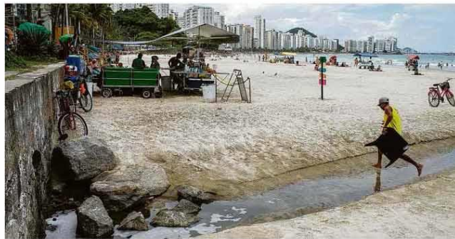
Saída de água pluvial, usualmente contaminada, na praia das Astúrias, no Guaruá (SP).

Acerca de evolução dos direitos de pessoas LGBT.