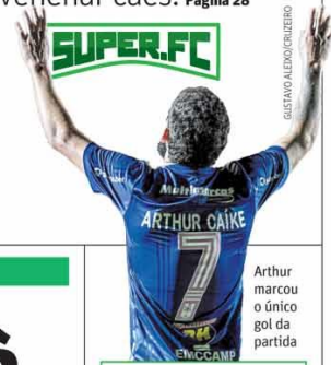
Arthur marcou o único gol da partida

Pagamento acabaria no dia 25. Mineradora propõe mais seis meses, reduzindo a quantia até encerrar, em abril, com 25% da parcela atual. Página 18