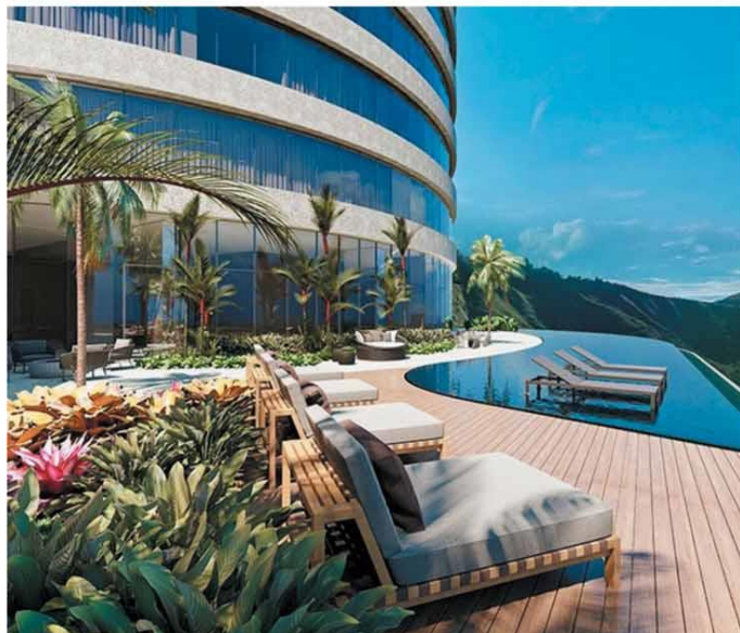
PARA POUÇOS – Imóveis de alto padrão chegam a ter 750 m²; em muitos, diferencial é a vista e a área de lazer