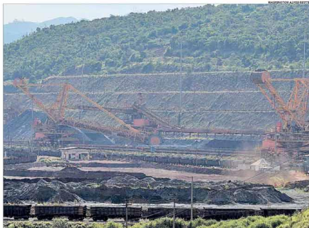
Investimentos no setor em Minas devem ser destinados, entre outros, a projetos de ferro e recuperação de barragens

As perspectivas positivas para a indústria da mineração no Brasil, com melhoria em diversos indicadores no terceiro trimestre, contribuíram para elevar as projeções de investimentos no setor, e Minas Gerais deve ser diretamente beneficiado. A expectativa é de que, de 2020 a 2024, sejam aportados no País mais de US$ 37 bilhões, sendo US$ 12,5 bilhões somente em terras mineiras. Os recursos no Estado seriam destinados a projetos de ferro, fertilizantes, ouro, bauxita, lítio, nióbio, quartzo e calcário. Ainda conforme o Instituto Brasileiro de Mineração (Ibram), as projeções de investimentos para Minas Gerais incluem também os programas de recuperação de barragens de rejeitos. Outros estados brasileiros que devem receber grande fatia dos investimentos são Bahia, com US$ 10,5 bilhões, e Pará, com US$ 8,6 bilhões. Pág. 5