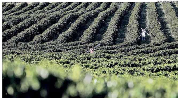
As atividades agrícolas, como a cafeicultura, estão entre as principais tomadoras de crédito rural em Minas

Dados divulgados pela Secretaria de Estado da Agricultura, Pecuária e Abastecimento (Seapa), referentes ao período de julho a setembro de 2020, mostram que já foram liberados para o setor agropecuário de Minas Gerais R$ 8,81 bilhões na safra atual. O valor representa um aumento de 16% em relação a igual intervalo da temporada anterior. A maior fatia dos recursos foi direcionada à agricultura: 68,7% ou R$ 6,05 bilhões. Entre as linhas de crédito, destaque para a de investimentos, que já acumula alta de 51%. O café continua liderando as contratações de custeio, seguido por soja, milho, cana-de-açúcar e algodão. Pág. 8