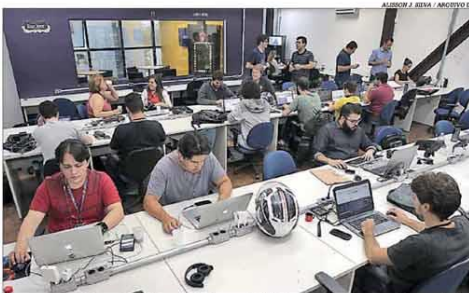
Para segmento, Marco Legal atenderia às especificidades das startups no cenário econômico

Projeto de lei de autoria do Executivo federal, redigido com o apoio da Abstartups, promete aprimorar o ecossistema nacional do empreendedorismo inovador, facilitar a contratação de soluções inovadoras e normalizar o ambiente regulatório experimental. A proposta de criação do marco, assinada por Jair Bolsonaro, foi enviada no começo desta semana ao Congresso. Pág. 9