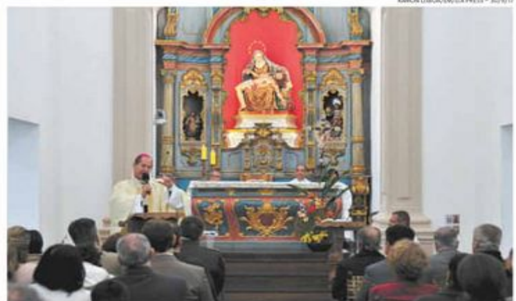
Em setembro de 2017, o arcebispo metropolitano de BH, dom Walmor Oliveira de Azevedo, celebrou missa comemorativa dos 250 anos de romaria na Serra da Piedade