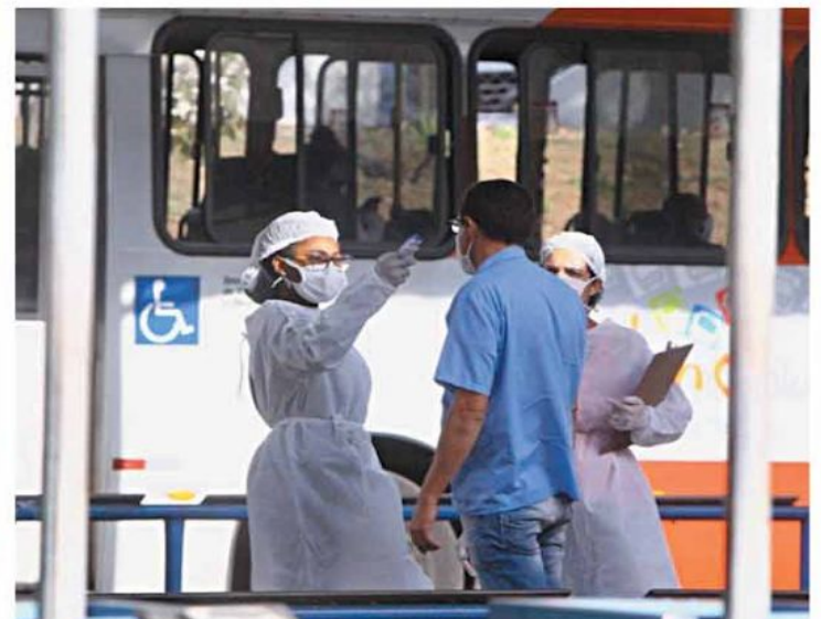
PENTE-FINO - Abordagem em estações serve para identificar passageiros contaminados