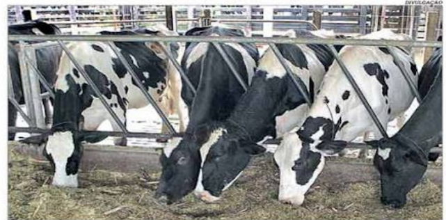
A substituição de parte da ração por silagem de soja gera resultados positivos

silagem de soja em substituição de parte da ração do rebanho. Os resultados têm sido positivos, com ganhos na qualidade do leite, na nutrição do rebanho e no corte dos custos, diante do maior peso da ração entre os insumos da produção leiteira. Pág. 8