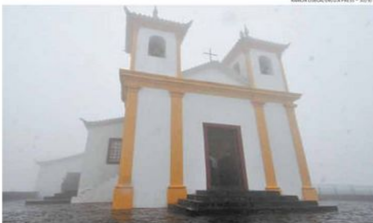
O Santuário de Nossa Senhora da Piedade fica a uma altitude de 1.740 metros, e já foi palco de importantes eventos religiosos e políticos