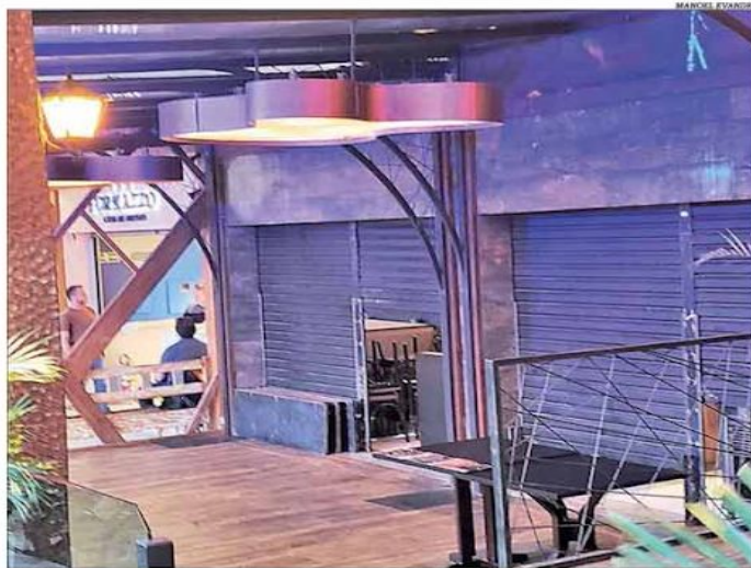
A Abrasel entrou com mandado de segurança para reabertura de bares e restaurantes