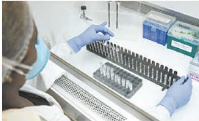
Testes serão realizados por três vezes a cada 14 dias para comparação

ASSINTOMÁTICOS Dois projetos coordenados por pesquisadores da