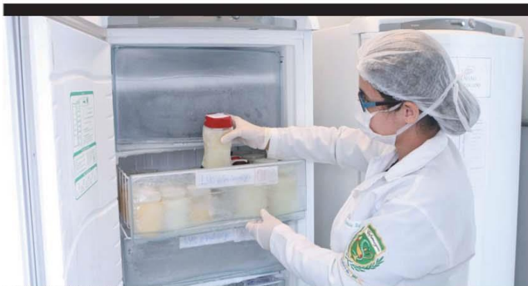
BAIXA NO ESTOQUE — Leite materno é imprescindível para os bebês internados, sobretudo os prematuros