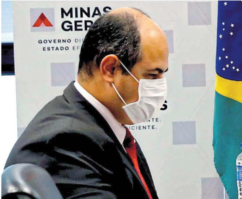
Prazo. Simões acredita que reunião com os Poderes pode definir a data de pagamento dos servidores