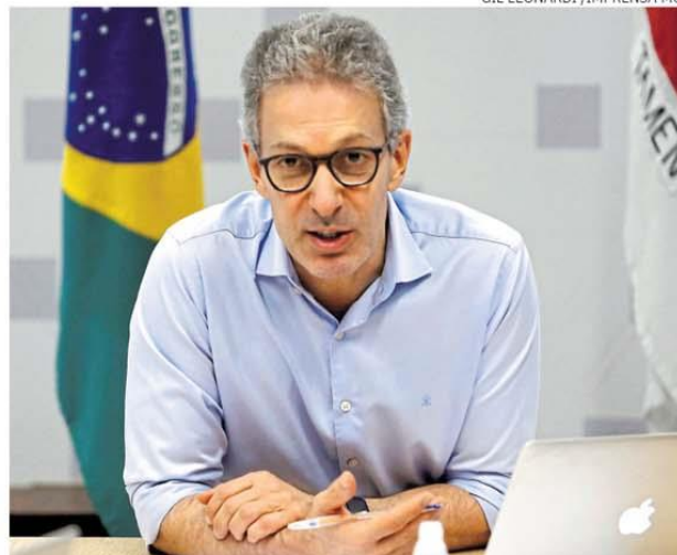
Zema vai se encontrar com os representantes dos outros Poderes