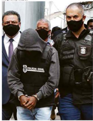
Suspeito de estupro de menina após ser preso pela Polícia Civil