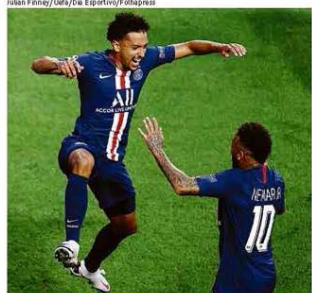
Maquinhos comemora com Neymar nos 3 a 0 em Lisboa Esporte B11 Com boa atuação de Neymar, PSG vence o RB Leipzig e alcança a sua 1ª final de Champions

Ilustrada B7 Professora resgata obra do abolicionista Luiz Gama em livro