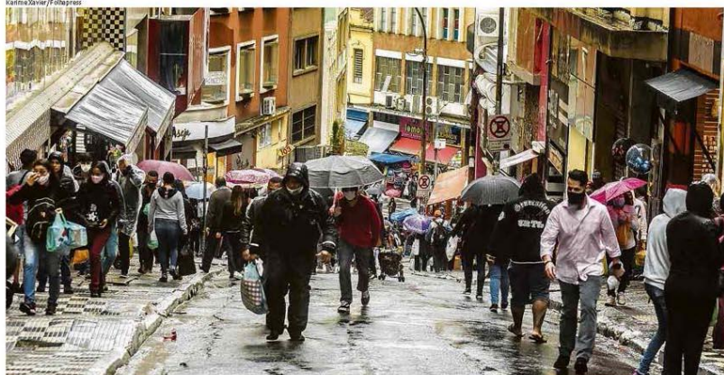
Movimento na ladeira Porto Geral, no centro de São Paulo, 11% de quem ganha até dois mínimos se dizem em isolamento total, contra 2% dos mais ricos

O número de brasileiros que se dizem em total isolamento ou que só saem de casa quando é inevitável vem caindo e atingiu o menor índice neste mês, apesar de o número de mortes diárias pela Covid-19 não arrefecer, mostra pesquisa Datafolha. Em 17 de abril, com 210 óbitos provocados pelo vírus, 21% se descreviam em isolamento completo e 55% saíam apenas se inevitável. Em 11 de agosto, quando foram confirmadas 1.274 mortes, esses totais caíram a 8% e 43%, respectivamente. Pela primeira vez há mais pessoas acreditando que a pandemia está melhorando do que piorando no país, revela o levantamento. Essa é a opinião de 46% agora, contra 28% no fim de junho. Os homens (55%) estão mais confiantes, e as mulheres (50%), mais pessimistas. De acordo com a pesquisa, nove em cada dez entrevistados declaram usar máscaras sempre que estão fora de casa, mas só metade diz ver os outros usando a proteção facial constantemente. O uso do equipamento em espaços públicos é o federal no país desde julho. Saúde B1