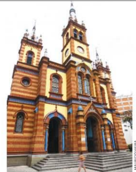
A Arquidiocese de BH liberou celebrações presenciais em 28 municípios, desde que a prefeitura de cada um autorize e que medidas contra a Covid sejam adotadas.