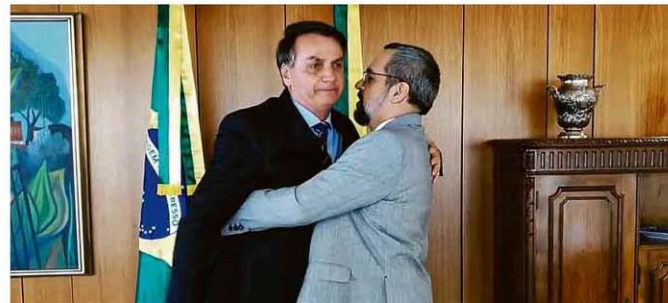
Aparentando do desconforto, Bolsonaro atende a pedido de Weintraub por abraço em vídeo de demissão.

Equipe de Guedes planeja criar mais uma meta fiscal