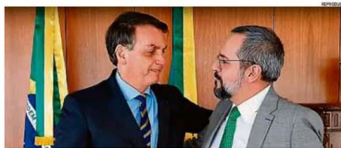
Despedida. Depois de anunciar sua saída da pasta, Weintraub pediu um "abracinho" ao presidente Bolsonaro