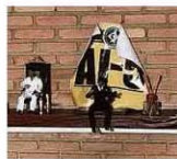
Cartaz em alusão ao AI-5, encontrado na casa onde estava Queiroz.

Queiroz é investigado por suposta participação em "rachadinha" na Assembleia do Rio, quando Flávio era deputado estadual —esquema no qual servidores são coagidos a devolver parte dos salários ao parlamentar. A prisão preventiva se deu por suspeita de interferência do ex-PM na apuração. Também alvo, a mulher dele tornou-se foragida. Poder360