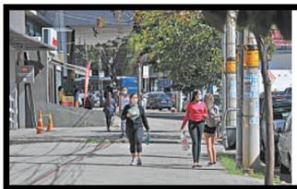
O Burity é o bairro com maior número de casos de COVID-19 em Belo Horizonte