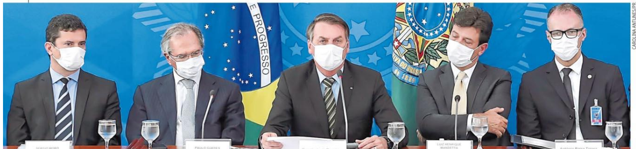
Bolsonaro e ministros anunciaram socorro de R$ 15 bilhões a empresas e trabalhadores informais; Moro informou que país estuda fechar fronteiras, e Guedes disse que novas medidas podem ser apresentadas

Decreto proíbe operação de qualquer estabelecimento que reúna mais de dez pessoas, o que inclui academias