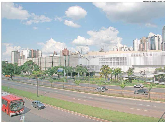
Com o coronavírus, a PBH decidiu suspender por tempo indeterminado a abertura de centros de compra

A edição extra do Diário Oficial do Município (DOM), publicada ontem à tarde, inclui na proibição de funcionamento casas de shows e espetáculos de qualquer natureza; boates, danceterias, salões de dança, casas de festas e eventos; feiras, exposições, congressos e seminários; shopping centers, centros de comércio e galerias de lojas; cinemas e teatros; clínicas de estética e salões de beleza; e parques de diversão. Kalil disse que a medida é uma resposta ao que chamou de recuo do governo estadual. Pág. 3