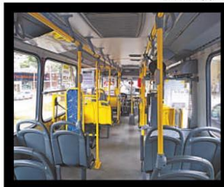
No Rua dos Coetês, no Centro, geralmente um formigueiro, havia poucas pessoas no início da tarde, enquanto o Circular O2 rodava sem passageiros