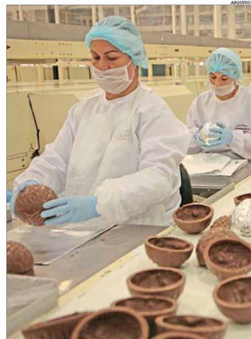
As indústrias de chocolate contrataram 14 mil temporários