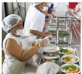
Restaurantes Populares entregarão 10,4 mil marmixes por dia em BH

texto prevê que, caso o estabelecimento tenha estrutura adequada, possam ser mantidos delivery ou retirada de produtos no local. Supermercados, farmácias, laboratórios, hospitais e demais serviços de saúde podem funcionar, mesmo em shoppings. Frigoríficos e montadoras já dão férias coletivas. Minas tem 19 casos confirmados, sendo dez na capital. Hospital Vila da Serra, em Nova Lima, investiu uma morte. Páginas 2 a 11