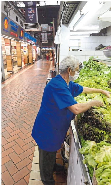
Antecipação. Ontem, antes mesmo do decreto municipal, corredores vazios do Mercado Central indicavam receio de ir à rua. Página 6

SEM RENDA, ARTISTAS LOCAIS PEDEM ATÉ CESTA BÁSICA. Página 11