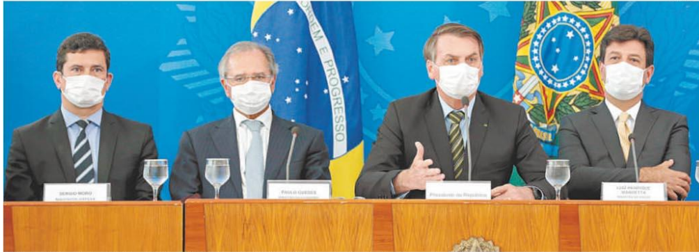
Ao lado dos ministros da Justiça, Sérgio Moro (E), da Economia, Paulo Guedes, e da Saúde, Luiz Henrique Mandetta (D), entre outros, o presidente Jair Bolsonaro deu entrevista para detalhar medidas de combate ao coronavírus