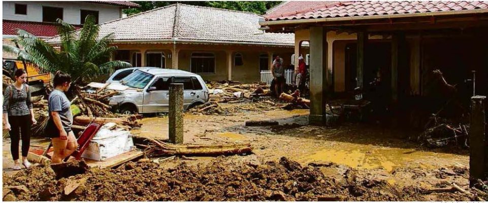
FORTES CHUVAS EM SANTA CATARINA DEIXAM AO MENOS 12 MORTOS E 13 DESAPARECIDOS

Estragos causa dos pelo temporal em Presidente Getúlio, município em que enxurrada provocou o maior número de vítimas; só na cidade foram registrados 120 mm em seis horas. Cotidiano B6