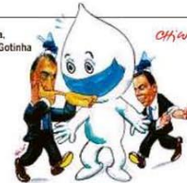
— Meninos, não briguem!