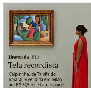
Tela 'Caipirinha', de 1923, leiloadá ontem

Esporte B9 Rússia é banida como nação de Olimpíadas e de mundiais por 2 anos