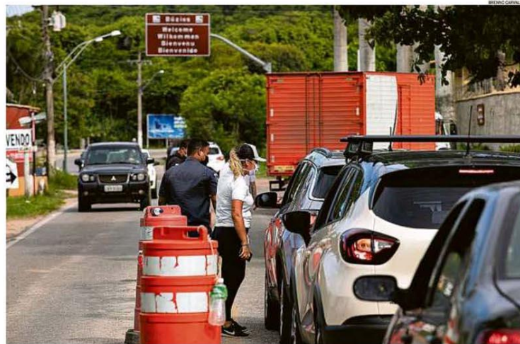
Paraíso fechado. Motoristas são parados em barreira na entrada de Búzios. O juiz Raphael Baddin de Queiroz visitou a cidade pessoalmente antes de decidir pelo fechamento

Google, Face e Zap misturados na ação antitruste do TExas PÁGINA 30