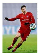
Robert Lewandowski, eleito melhor do mundo pela Fifa

Esporte B9 Rússia é banida como nação de Olimpíadas e de mundiais por 2 anos