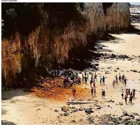
Praia de Pipa logo após o desabamento de falésia que matou família (ao lado)