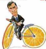
— Vou botar os laranjas pra rodar!