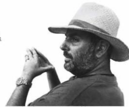
Cao Guimarães e Petra Costa participaram, e a Orquestra de Ouro Preto também está lá. Mineiros enriquecem documentário sobre o cineasta Hector Babenco. ALMANAQUE—P.10

HOJEEMDIA.COM.BR - ANO XXXII - Nº 11.472 ASSINATURA/RELAZAMENTO COM O ASSINANTE: (31) 3226-8000 - HOJEEMDIA.COM.BR/ASSINE WHATSAPP: (31) 98497-0510 - E-MAIL: ATENDIMENTO@HOJEEMDIA.COM.BR