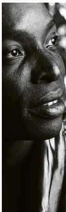
Imagem do músico exposta no museu online que o homenageia Olivia Figueira