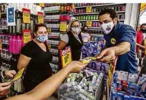
Boulos em loja na estrada do M'Boi Mirim