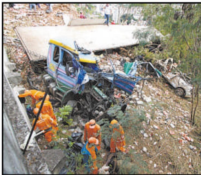
Uma pessoa morreu e outra ficou gravemente ferida no acidente de ontem, que envolveu uma carreta e um carro de passeio

Palco de inúmeras tragédias semelhantes, o local é tema de debates polêmicos que envolvem as três esferas de governo e a população de BH. Sobretudo pela intensa circulação de veículos de carga na região, que usam o corredor para escoar suprimentos dentro e fora da cidade. Muito próximo do tráfego urbano da capital, o trecho da MGC-356 em questão é avaliado por engenheiros de trânsito como inadequado à movimentação de caminhões de grande porte e carretas. Repensar o transporte de cargas na localidade, alertam os especialistas, é a única maneira de pôr fim aos sucessivos desastres que,