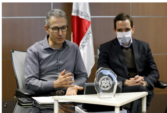
Gil Leonardi / Imprensa MG

Pavimentação de 61 quilômetros da rodovia interligará Minas até divisa da Bahia