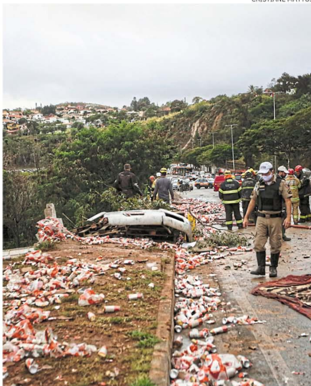
DER-MG disse que os reparos na pista estão sendo providenciados

FLUXO. Os dados mais recentes de uma empresa de publicidade que tem uma câmera instalada na região do acidente mostram que, entre 14 de fevereiro e 5 de maio deste ano, 2.418.470 veículos passaram pelo local no sentido Rio de Janeiro. A média é de mais de 115 mil por dia.