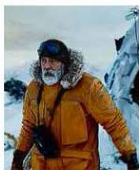
George Clooney em "O Céu da Meia-Noite"

Mirando o espaço, George Clooney dirige e estrela "O Céu da Meia-Noite", filme que chega agora à Netflix — e em que ele destrói o planeta e mostra que o descalço com o ambiente pode levar a catástrofe.