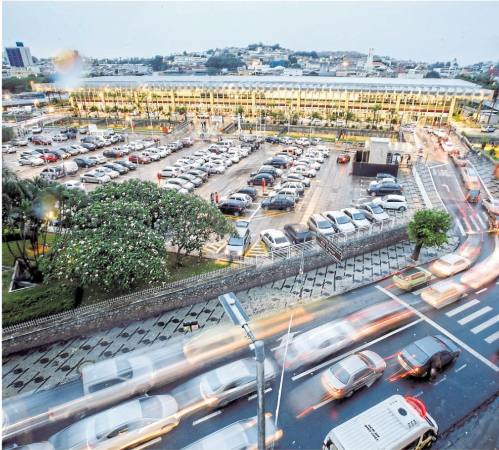
Planos. Terminal rodoviário de BH pode mudar de lugar para espaço ser usado em outras atividades