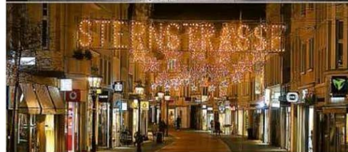
Com medidas mais rigorosas de isolamento para conter o avanço do vírus na Alemanha, a Sternstrasse, rua comercial de Born, ficou vazia de um dia para o outro. Dinamarca também fechou comércio. PÁGINA 26