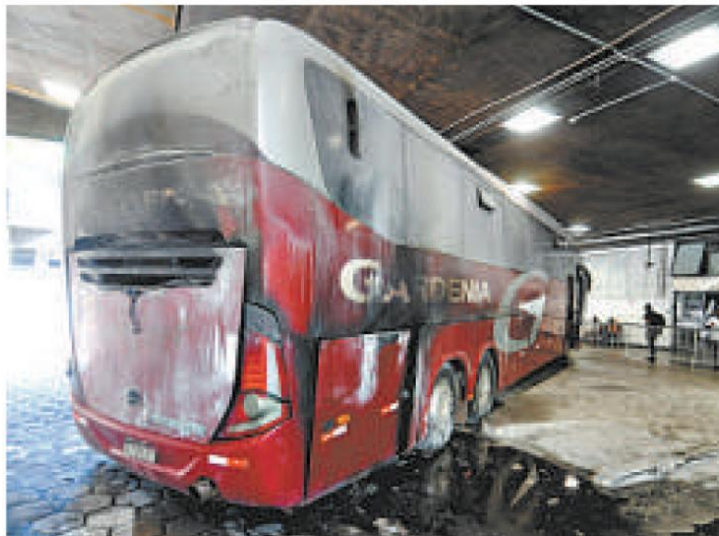
Veículo estava na área de embarque e desembarque do terminal