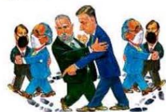
...são dois pra lá, dois pra cá...

Enquanto a vacina não vem... segue o baile!