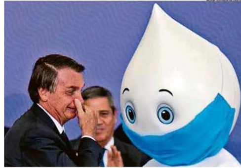
Contradição. Bolsonaro com Zé Gotinha, personagem criado após o fim da epidemia de dengue para incentivar vacinação