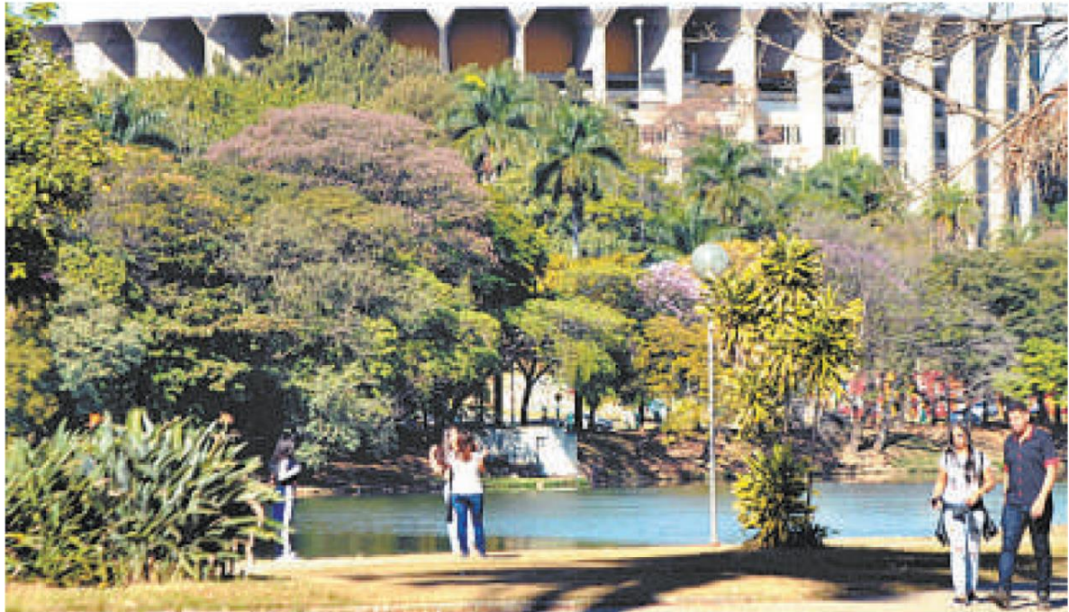
Vista externa do Mineirinho: governo diz que empresa internacional já demonstrou interesse na administração do espaço, hoje subutilizado