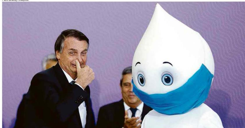
'Se algum de nós extrapolou ou até exagerou, foi no afã de buscar solução', diz Jair Bolsonaro, sem máscara, ao lado da mascote Zé Gotinha, com máscara

“Para que essa ansiedade, essa angústia? Somos a referência na América Latina. E estamos trabalhando para prestar contas”