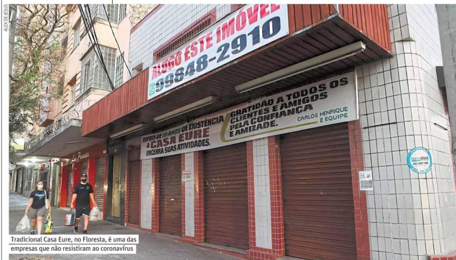
Tradicional Casa Eure, no Floresta, é uma das empresas que não resistiram ao coronavírus