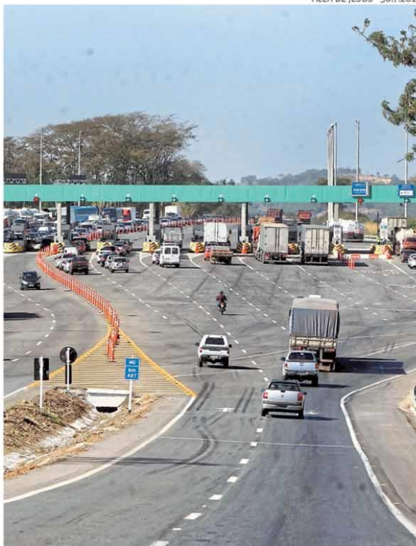
Valor do pedágio na BR-040 pode cair, mas depende de novo contrato