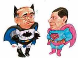
— Estamos juntos, colega? —