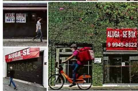
Diante da crise, faixas de Aluga-se' multiplicam-se por todas as regiões de São Paulo, do comércio popular do centro a lojas em bairros nobres das zonas sul e oeste.