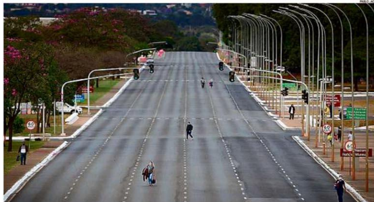
Esplanada deserta. Diante do risco de "atos anticonstitucionais" e de ameaça à Cúria Metropolitana de Brasília, o governo do Distrito Federal fechou a Esplanada dos Ministérios

presidente Jair Bolsonaro afirmou em nota que o governo adota cautela diante de "ataques concretos" e que tomará "medidas legais para proteger a Constituição". PÁGINA 4