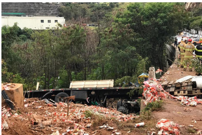
Carreta carregada com cerveja perdeu o controle e saiu da pista na BR-356, próximo ao Ponteio