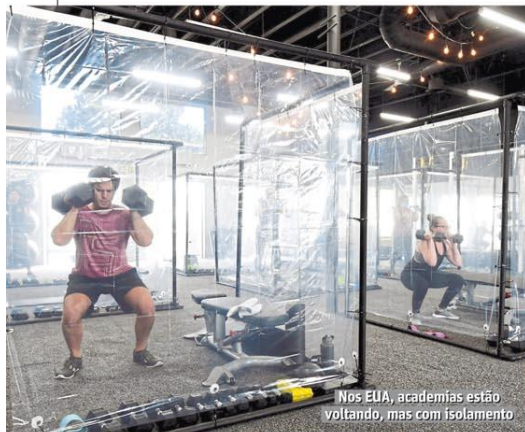
Nos EUA, academias estão voltando, mas com isolamento