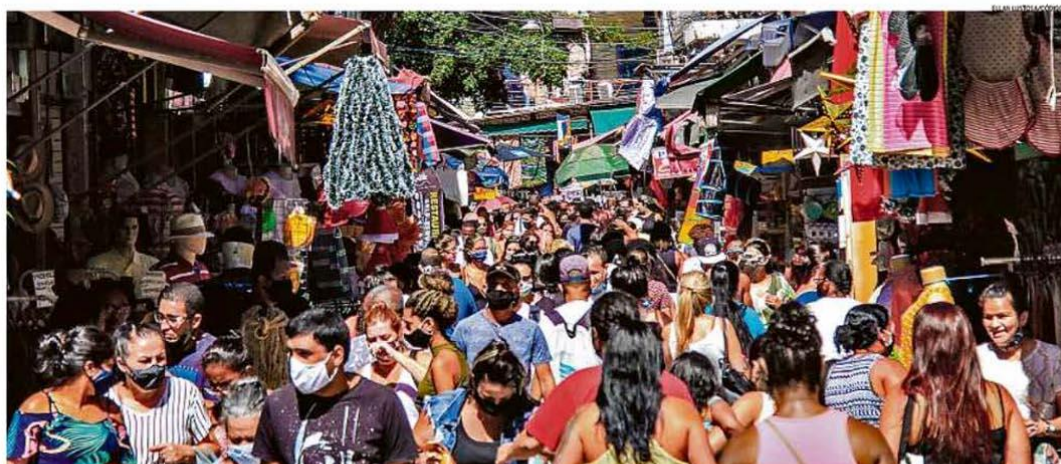
Desejo de aglomerar. A Saara, no Centro, ficou lotada ontem. A Procuradoria-Geral do Município disse que vai responder ao questionamento da Justiça sobre a autorização para festas em cercadinhos nos quiosques da orla no réveillon

Vacinação será em até 5 dias após registro na Anvisa, diz AGU PÁGINA 16