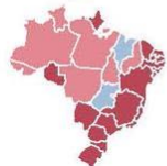
Dados de 20h de 15 de 1ª média móvel de 7 dias | **Em relação a 14 dias

Estado: Entregas da pandemia: Acelerado, Estável, Desacelerado, Reduzido