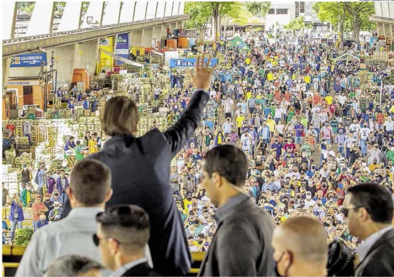
Aglomeração no Ceagesp. Bolsonaro acena para multidão na reinauguração da torre do relógio. Segurança sanitária não foi respeitada no evento