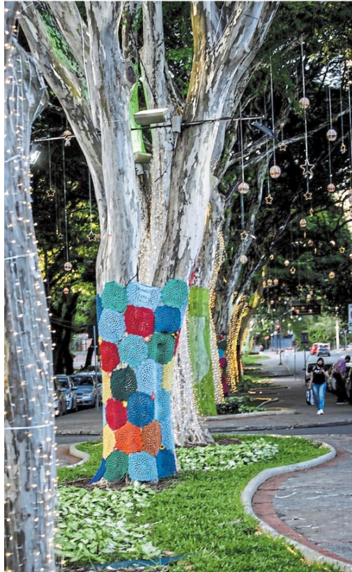
Enfeites mineiros. Árvores da avenida Barbacena, em BH, foram decoradas com crochê da cidade de Inconfidentes. Página 22