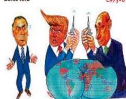
— Vacinação do mundo? Obrigado, eu não!