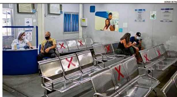
Termômetro do SUS. Na UPA da Tijuca, letada no início da pandemia, o número de pacientes com Covid-19 começou a cair em junho

Pesquisa mostra que infecções por Covid nas UPAs do Estado do Rio caíram para 8% dos pacientes testados. Em abril e maio, chegaram a quase dez vezes mais. Cientistas estudam três hipóteses para a queda. PÁGINA 10