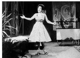
A cantora Elizeth Cardoso em apresentação de 1959. Reprodução

No Reino Unido, estátua da ativista negra Jen Reid substitui escultura do traficante de escravos Edward Colston, que foi derrubada em protesto do movimento Black Lives Matter. Mundo A16