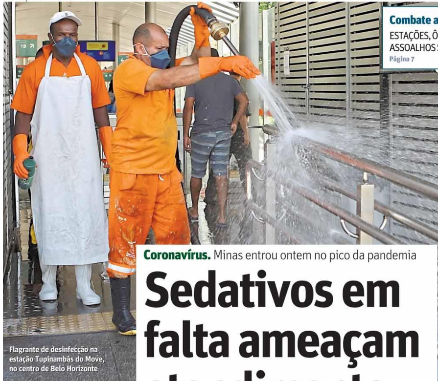
Flagrante de desinfecção na estação Tupinambás do Move, no centro de Belo Horizonte