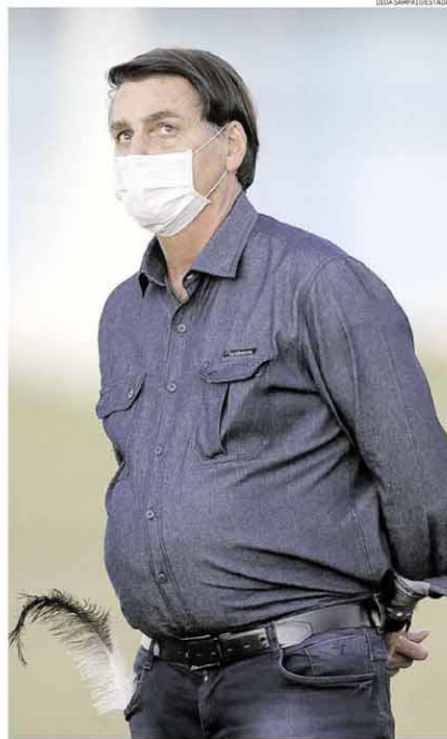
Isolado. Bolsonaro (com uma pena das emas do Alvarada) sancionou lei

fesa o principal foco de tensão na região. A soberania e o desenvolvimento de ações de preservação da Floresta Amazônica estão entre as prioridades da nova PND. O documento também pede atenção ao Atlântico Sul, onde se concentram as reservas do pré-sal. Pela primeira vez, a PND trata dos desdobramentos das mudanças climáticas e de pandemias. O texto destaca que esses fenômenos poderão "acarretar consequências ambientais, sociais, econômicas e políticas, pedindo pronta resposta do Estado". POLÍTICA / PÁG. 44