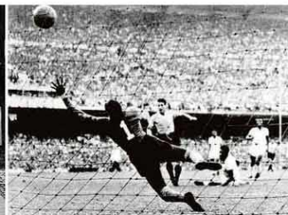
Pepemarca gol do Urugual na final da Copa de 1950. 16 JULHO

A perda de ocupação de trabalhadores informais em meio à pandemia do novo coronavírus é mais que o dobro daquela registrada entre empregados formais, aponta estudo do Ibope FGV. Com nível recorde de pessoas fora do mercado, devido ao isolamento social e também à garantia de uma renda mínima pelo auxílio emergencial, a volta desses trabalhadores à procura por uma ocupação deve pressionar a taxa de desemprego nos próximos meses. Ela era de 12,9% no trimestre encerrado em maio.