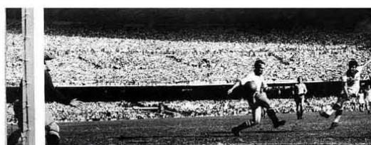
Chico faz gol do Brasil, que derrotou a Suécia por 7 a 1 na Copa de 1950, no Maracanã.

Rosângela Corrêa coloca máscara em criança na comunidade do Miolo, na zona oeste; profissionais, em sua maioria mulheres, se expõem e enfrentam de desinformação o baile funk enquanto reforçam medidas de proteção na periferia da cidade. Saúde B3