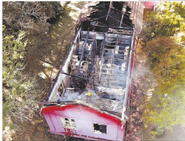
CORPO DE BOMBEIROS MINEIRO DE MINAS GERANDO VISUALIZAÇÃO