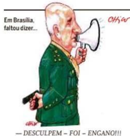
Em Brasília, faltou dizer...

A extremista Sara Giromini foi presa sob acusação de captar recursos para financiar crimes contra a segurança nacional. Outros cinco mandados de prisão foram expedidos pelo ministro Alexandre de Moraes, do Supremo Tribunal Federal, contra integrantes do grupo radical bolsonarista "300 do Brasil". PÁGINA 5