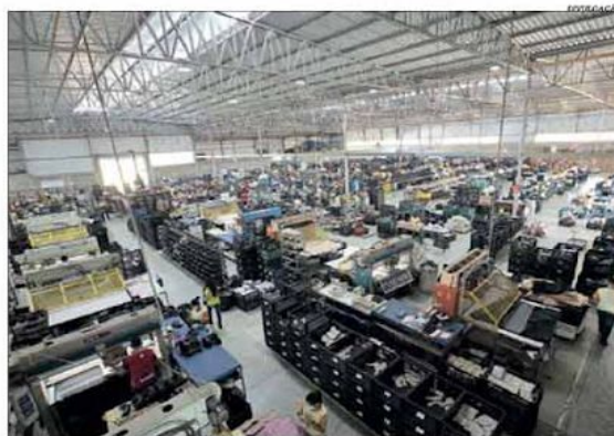
Devido à logística, indústrias diversas, como a calçadista, têm prosperado na região

A empresa já disponibilizava planos de saúde via modalidade eletrônica para clientes individuais desde 2017 e, há dois meses, decidiu estender o serviço às micro e pequenas empresas (MPEs). Vale destacar que cerca de 80% da carteira da Unimed-BH é formada por planos coletivos. A opção pela novidade se deu, entre outros, pela necessidade de garantir a segurança dos clientes na pandemia. Pág. 9