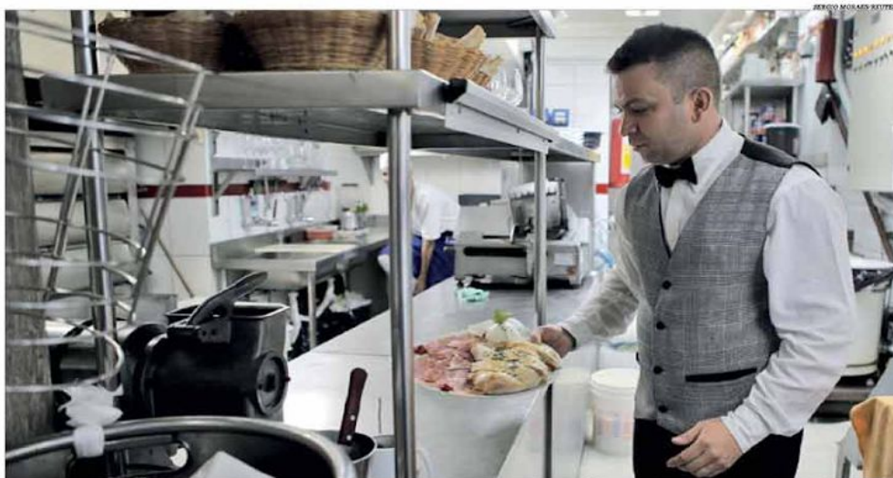
Aos poucos, os serviços em Minas Gerais vão se recuperando diante da reabertura gradual da economia em meio à pandemia da Covid-19

Em agosto, o volume de serviços somou o terceiro aumento consecutivo no Estado. As atividades que apresentaram resultados positivos no confronto com igual mês de 2019 foram serviços profissionais, administrativos e complementares (1%) e outros serviços (10,3%). Pág. 5