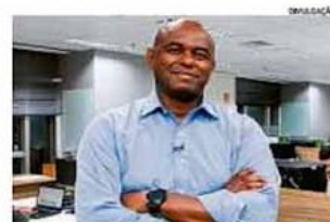
O vice de Finanças da Bayer: "Pioneirismo atra críticas"

Executivo da Bayer defende programa de trainees para negros. "Difícil é convencer as pessoas de que elas podem e merecem participar." PÁGINA 24