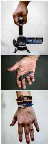
Objetos de jornalistas que se refugiaram no país