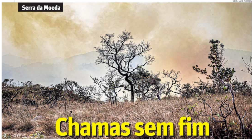
Serra da Moeda