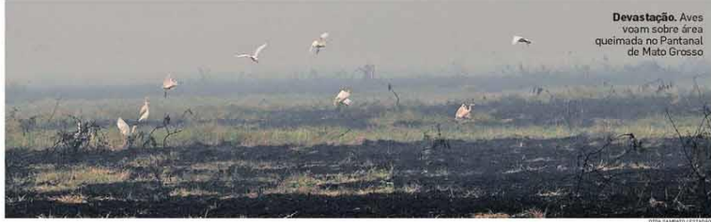
Devastação. Aves voam sobre área queimada no Pantanal de Mato Grosso

O governo federal reconheceu ontem a situação de emergência em Mato Grosso do Sul em decorrência dos incêndios florestais. O fogo que destrói desde julho o bioma mais úmido do planeta engoliu 64,8% dos 108 mil hectares do Parque Estadual Encontro das Águas, em Mato Grosso. Desde a semana passada, o Estadão mostra in loco a devastação na área. METRÓPOLE / PÁG. A13