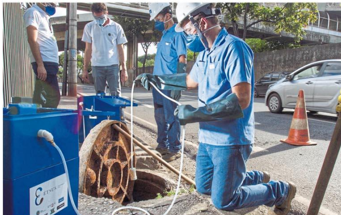
Novo risco. Trabalho inédito coordenado pela UFMG colhe amostras do esgoto para que laboratório verifique presença de coronavírus em dejetos; na Europa, vírus foi encontrado em fezes de doentes. Página 11

■ Advocacia Geral da União recorre de liminar que dá a governadores e prefeitos competência para definir regras de isolamento, para que obedeçam ao governo federal. Página 9