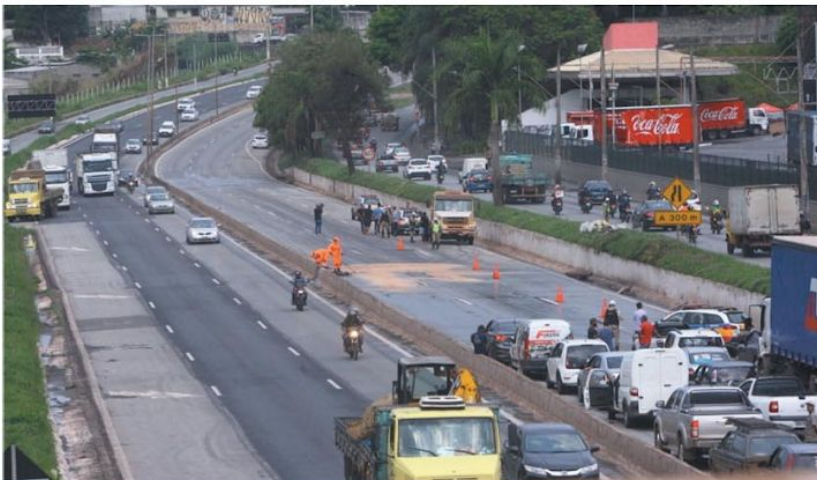
IMPACTO NA SAÚDE – Historicamente, acidentes de trânsito são responsáveis pela ocupação de 60% dos leitos de hospitais no país