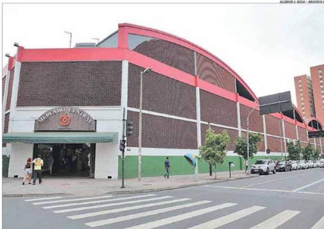
Inaugurado em 1929, o Mercado Central é um dos principais pontos turísticos e comerciais de Belo Horizonte

belo-horizontino, como o Mercado Central, aberto em 1929, que virou um dos principais pontos turísticos e comerciais de BH, o laboratório Hermes Pardini e o restaurante Bolão. Pág. 18