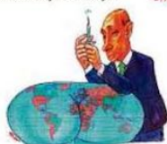
Sputnik no mundo!