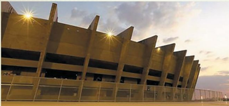
GIGANTE RENTÁVEL – Estádio é considerado ponto principal da chamada "indústria do futebol"