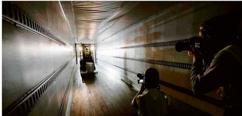
Primeiro dia de embarque de doses da vacina da Pfizer é acompanhado pela mídia em centro de distribuição da farmacêutica em Michigan.