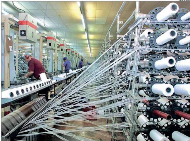
A produção da indústria têxtil aumentou 42,3% no terceiro trimestre em relação aos três meses anteriores em Minas