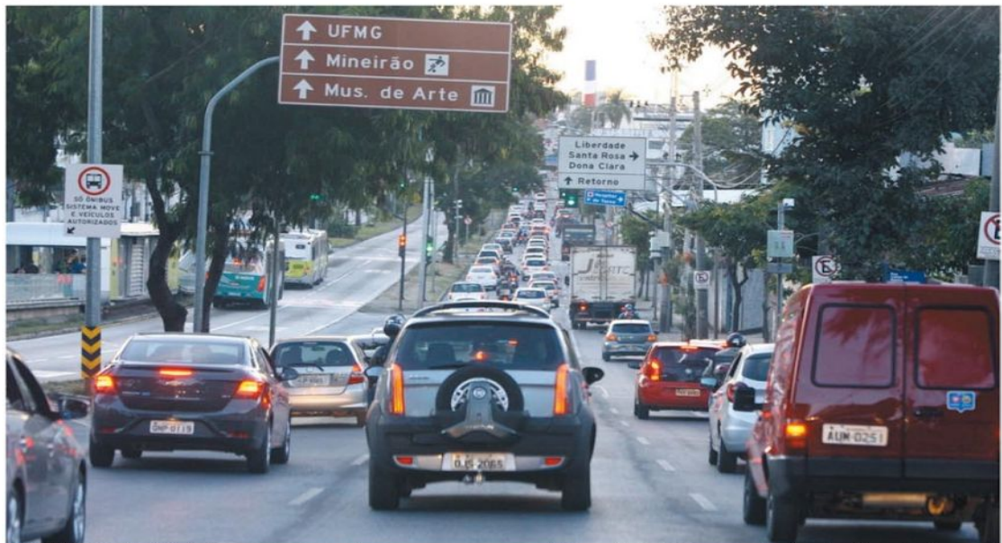
PREOCUPANTE – Flexibilização da quarentena levou mais carros para as ruas; para especialistas, acidentes tendem a aumentar e impactar sistema de saúde