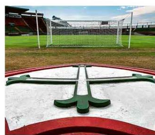
Gramado do Canindé, em São Paulo

Integrantes das Forças Armadas trabalham na limpeza das áreas de visitação do monumento, que voltará a ser aberto ao público amanhã, no Rio Saúde B3