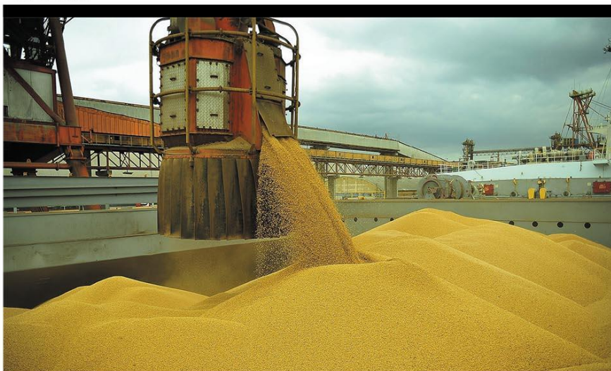
CAMPO FÉRTIL – Colheita de grãos foi 6,4% maior do que em 2019, chegando a 15,1 milhões de toneladas; destaque para soja, amendoim e sorgo