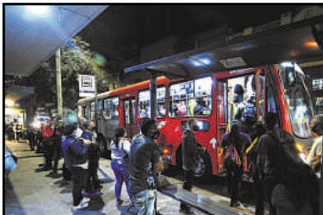
Passageiros embarcam em coletivo no Centro da capital mineira, na noite do dia 6, quando o comércio começou a ser flexibilizado na cidade

O advogado lembrou ainda declarações do próprio Sindicato das Empresas de Transporte de Passageiros (Setra-BH), que, em 5 de agosto, admitiu a invia-