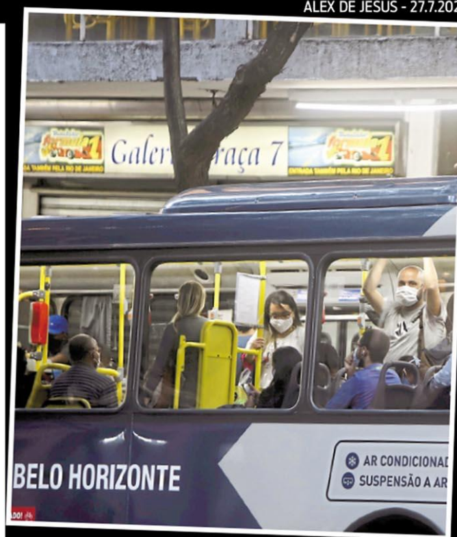
■ Quadros de horários de ônibus foram reduzidos