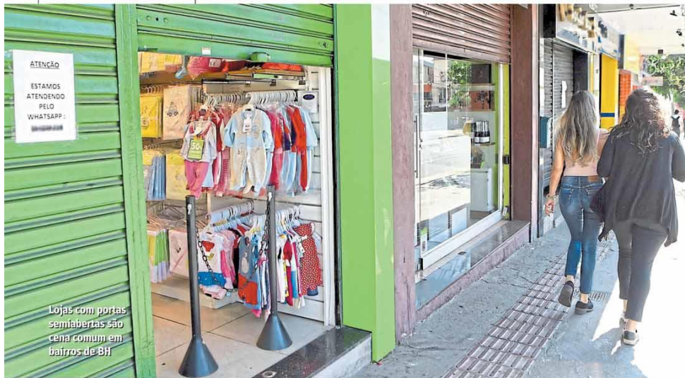
Lojas com portas semilabertas são regra comum em bairros de BH