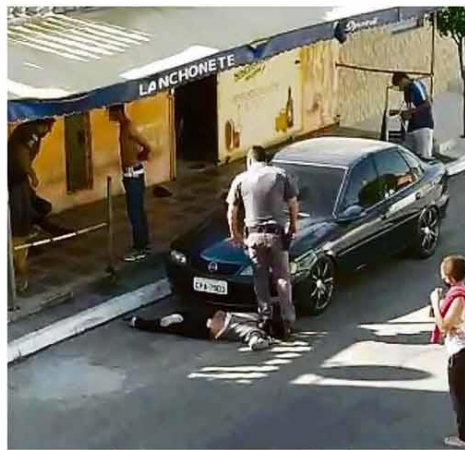
PM Pisa no pescoço de uma comerciante de 51 anos, em Parelheiros (zona sul de SP)

Os casos mais alarmantes são os de Amapá, Minas Gerais, Rio Grande do Norte, Roraima, Rondônia e Tocantins, que ainda não fizeram o aumento obrigatório. Há pressão por parte desses estados para que o prazo seja prorrogado. Mercado A12