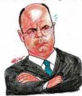
—Humpf! Não brinco mais...

Enquanto isso, no Estado a que chegamos... CHAVE