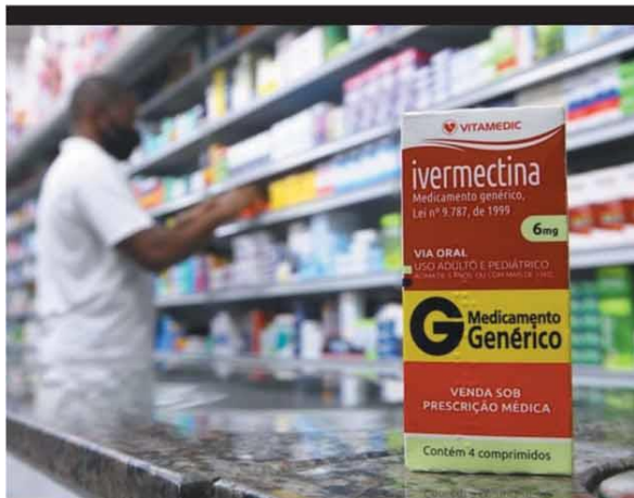
ALERTA - Drogarias em BH registraram aumento da procura pelo medicamento