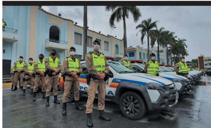
MOBILIZAÇÃO - Cento e trinta viaturas partiram da capital mineira para o interior, para dar suporte à votação