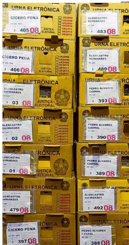
Dentro da caixa. Urnas eletrônicas preparadas para a distribuição em locais de votação no Rio de Janeiro

Um em cinco brasileiros reside em casa de madeira ou sem banheiro, diz IBGE. Concentração de renda cresceu, e país é o nono mais desigual do mundo. PÁGINAS 26 e 27