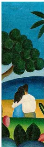
Tela 'Idílio', de Tarsila do Amaral. Reprodução

Branco tem 74% de verba eleitoral na capital paulista Em São Paulo, 65% dos candidatos são brancos, que detêm um volume de recursos maior, 74% de toda a verba pública. O número contrasta com a determinação do STF de divisão equitativa de fundo eleitoral e partilhado para negros e brancos. Poder A8