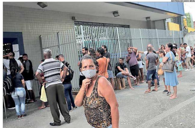
Em abril, o número de pedidos de seguro-desemprego em Minas Gerais foi o segundo maior do País

Minas Gerais registrou em abril o segundo maior número de pedidos de seguro-desemprego do País, atrás apenas de São Paulo. Foram feitas 85.990 requisições no Estado no mês passado, com expansão de 35,8% frente a março e de 27,2% sobre o mesmo mês de 2019, uma consequência imediata do impacto da pandemia do novo coronavírus no mercado de trabalho. No primeiro quadrimestre, os pedidos do benefício em Minas atingiram 268.118, com alta de 2,7% na comparação com igual período do ano passado. Pág. 6