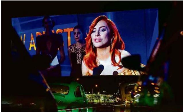
Carros emfileirados diante do sessão do filme 'Nasceu uma Estrela' em cinema drive-in de Praia Grande (SP)

Dólar fecha em alta de 0,9% e vai a recorde de R$ 5,87; real é divisa que mais se desvaloriza no ano Mercado A20