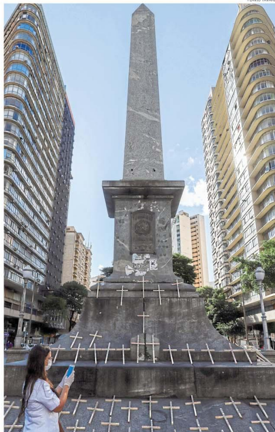
Protesto silencioso. No Dia Internacional da Enfermagem, praça Sete recebe 98 cruzeiros, cada uma com o nome de um profissional morto por Covid-19 no Brasil. Página 4

GOVERNO FEDERAL ADIA O PAGAMENTO DE R$ 9,6 BILHÕES EM IMPOSTOS. Página 9