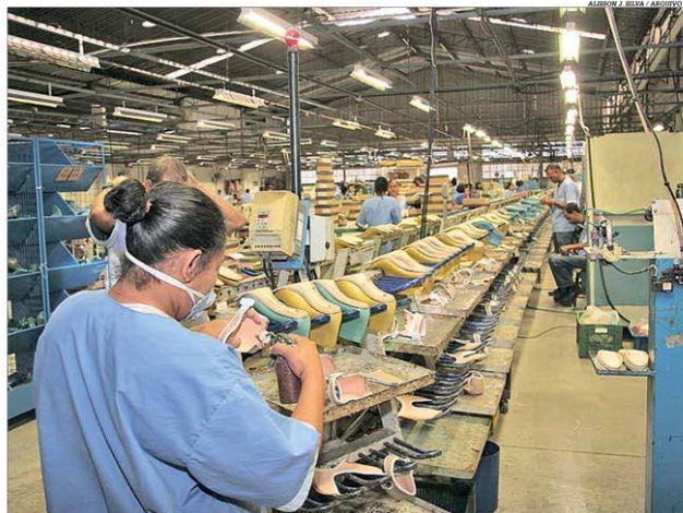
Sem demanda, fabricantes do polo de calçados de Nova Serrana demitiram toda a equipe de produção