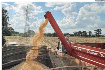
A produção de milho no Estado deve chegar a 7,8 milhões de toneladas