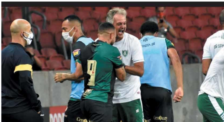
CASAMENTO PERFEITO - Coelho e Lisca vêm fazendo história na Copa do Brasil, ontem o time largou na frente nas quartas de final

Decisão obriga BMG a veicular áudio explicando que está proibido de fechar, por telefone, contrato de cartão de crédito com desconto direto no pagamento de maiores de 60 anos. Instituto de Defesa Coletiva, que impetrou ação há 14 anos, vê abuso na conduta. Banco diz que age de forma ética e pode recorrer. PRIMEIRO PLANO - P.2