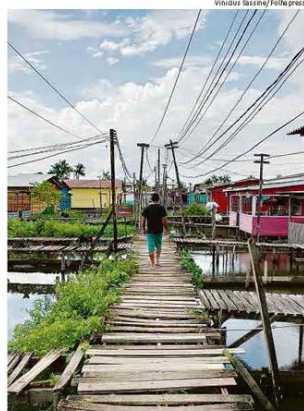
Bairro pobre de Macapá sofre com apagão e falta d'água

A Anvisa autorizou a retomada dos testes da vacina Coronavac, produzida pela chinesa Sinovac em parceria com o Instituto Butantan. A suspensão, anunciada na segunda (9), foi questionada e gerou novo atrito entre Jair Bolsonaro e João Dória. Saúde B2