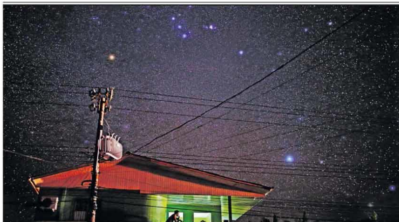
Apagão no interior do Amapá coloca vacinas em risco

Uma das ações que o governo discute para a Amazônia é a expropriação de propriedades no campo e nas cidades com registros de queimadas e desmatamentos ilegais. Proposta deve ser enviada em 2021 ao Congresso. Entidades ambientalistas e rurais demonstram ceticismo. METRÓPOLE/PÁG. A18