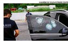
Queima-roupa. Os tiros no vidro do carro da candidata