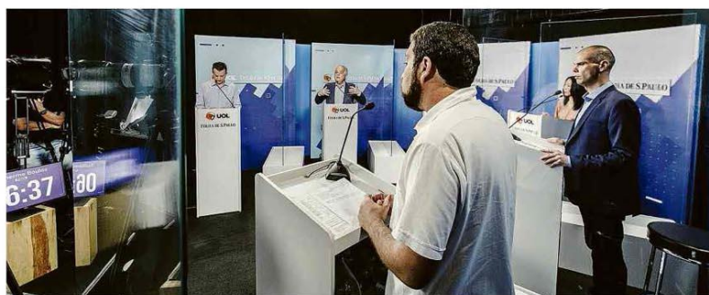
Candidatos à prefeitura paulista participam de debate Folha/UOL; à esquerda, o relógio que contava o tempo de fala de cada postulante.

Para o juiz, o registro da pesquisa deveria trazer separadamente todos os estratos de instrução do universo a ser entrevistado, por exemplo. Dados como escolaridade são resultados, não critérios orientadores para a segmentação de entrevistados. Poder A5