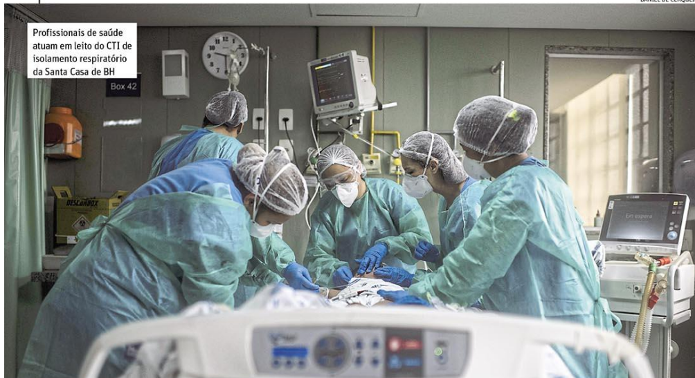
Profissionais de saúde atuam em leito do CTI de isolamento respiratório da Santa Casa de BH Box 42

Relatório Resumido de Execução Orçamentária mostra que pouco mais de R$ 1,9 bilhão foram efetivamente investidos em hospitais, campanhas de prevenção e abertura de leitos, por exemplo, até junho. Isso equivale a 7,76% da receita total do governo, e o mínimo constitucional é 12%. Estado tem até o fim do ano para equilibrar essa conta. Página 7