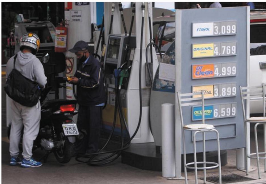
PESO NO BOLSO - O litro da gasolina passou de uma média R$4,062 para R$4,248 em postos de BH, Betim e Contagem pesquisados