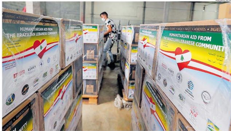
Ajuda brasileira. Caixas com 5,5 toneladas de doações, armazenadas em Guarulhos antes do embarque para o Líbano, amanhã, em avião da FAB