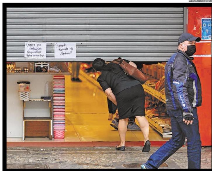
JETINHO PARA FUNCIONAR / O comércio de artigos não essenciais deveria estar todo fechado ontem na capital. Mas o reportagem do EM flagrou lojas no Centro recebendo clientes com a porta entreaberta (acima) e pelo menos três que conseguiram operações no alvará de funcionamento, incluindo a venda de alimentos, para podermos manter em plena atividade. A autorização da Prefeitura de BH para a abertura do comércio não essencial vigorou de quinta-feira a sábado da semana passada e, nesta, vai de quarta a sexta-feira. PÁGINA 9

EM CULTURA Impasse tira Chaves do ar Falta de acordo entre a família de seu criador, Roberto Bolaños, morto em 2014, e o emissora mexicana Televisa encerrou o exibição do seriado, iniciado nos anos 1970, inclusive no Brasil. CAPA