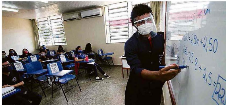
Professor dá aula para turma da escola dual Petrólio Portela, em Manaus, no primeiro dia de conteúdo presencial após a pandemia.

Embora tenha dado aval a Guedes para negociar com congressistas, nos bastidores o presidente Jair Bolsonaro afirma acreditar que dificilmente um novo tributo vá ter apoio do Legislativo. E considera que a medida, caso seja viabilizada, poderá desgastar a imagem do Planalto. Mercado A14