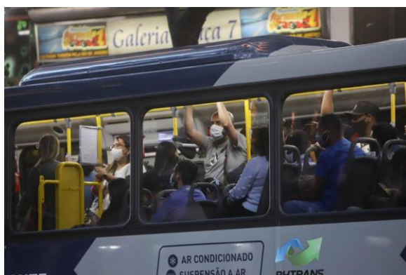
Vários ônibus lotados circulam em BH

Por Natália Oliveira | Siga pelo twitter 10/08/20 - 16h33